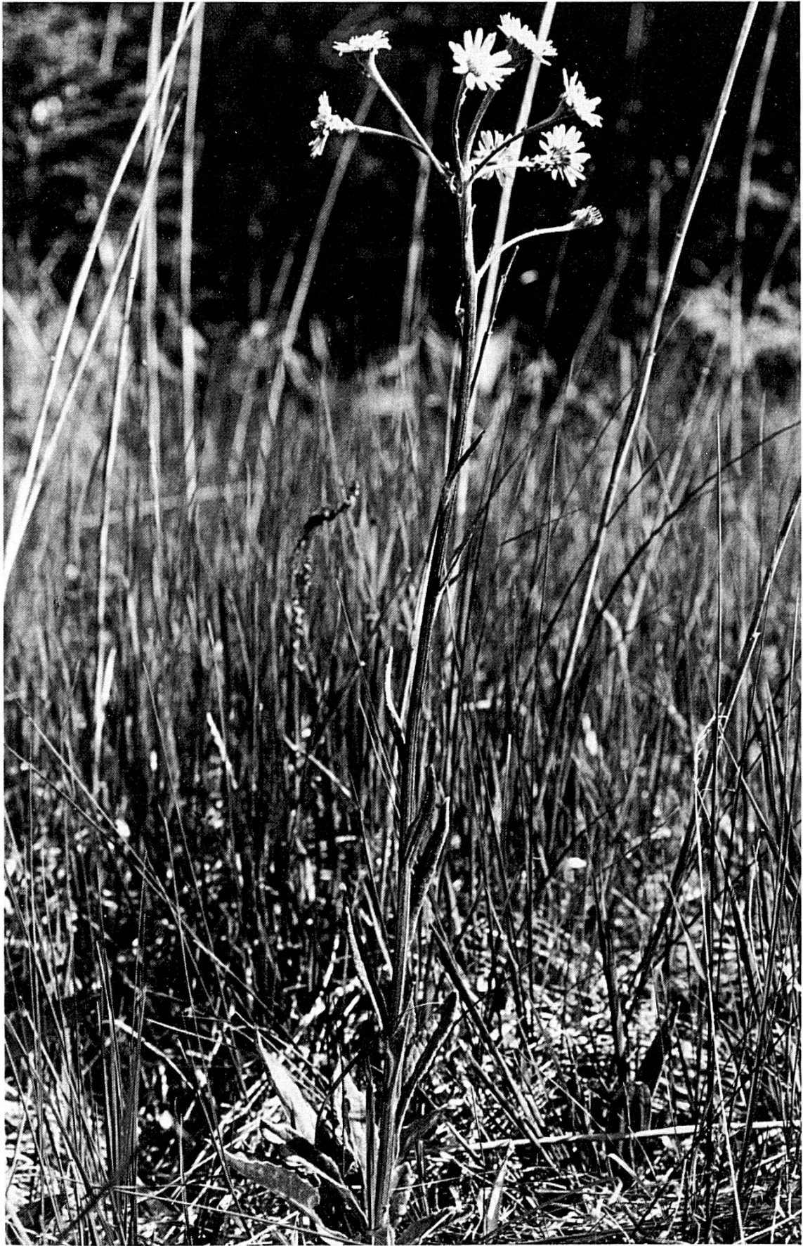
Le Séneçon à feuilles spatulées (Senecio spathulifolius (Gmel.) Griesselich) à la tourbière des Royes.