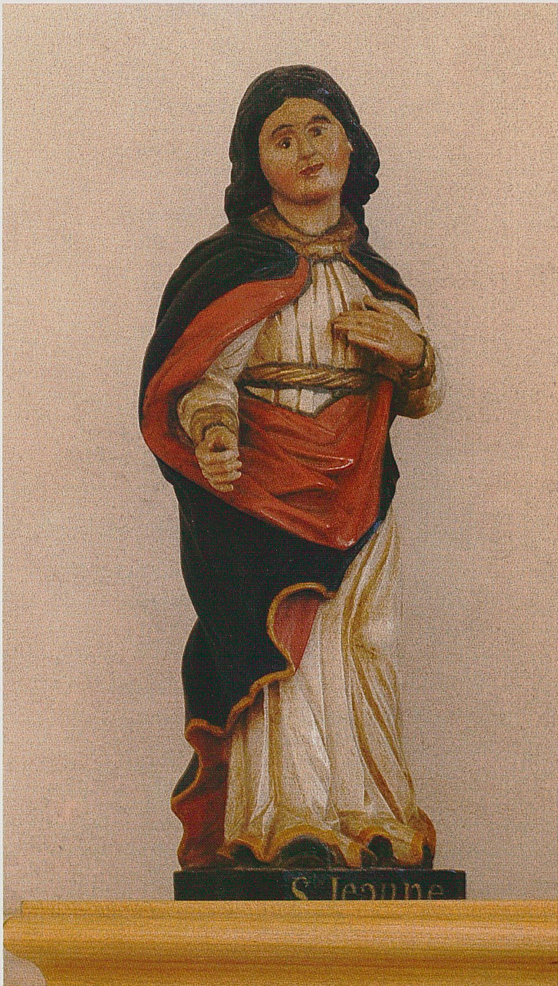
Statuette représentant la sainte Jeanne de la Bosse à l'intérieur de la chapelle