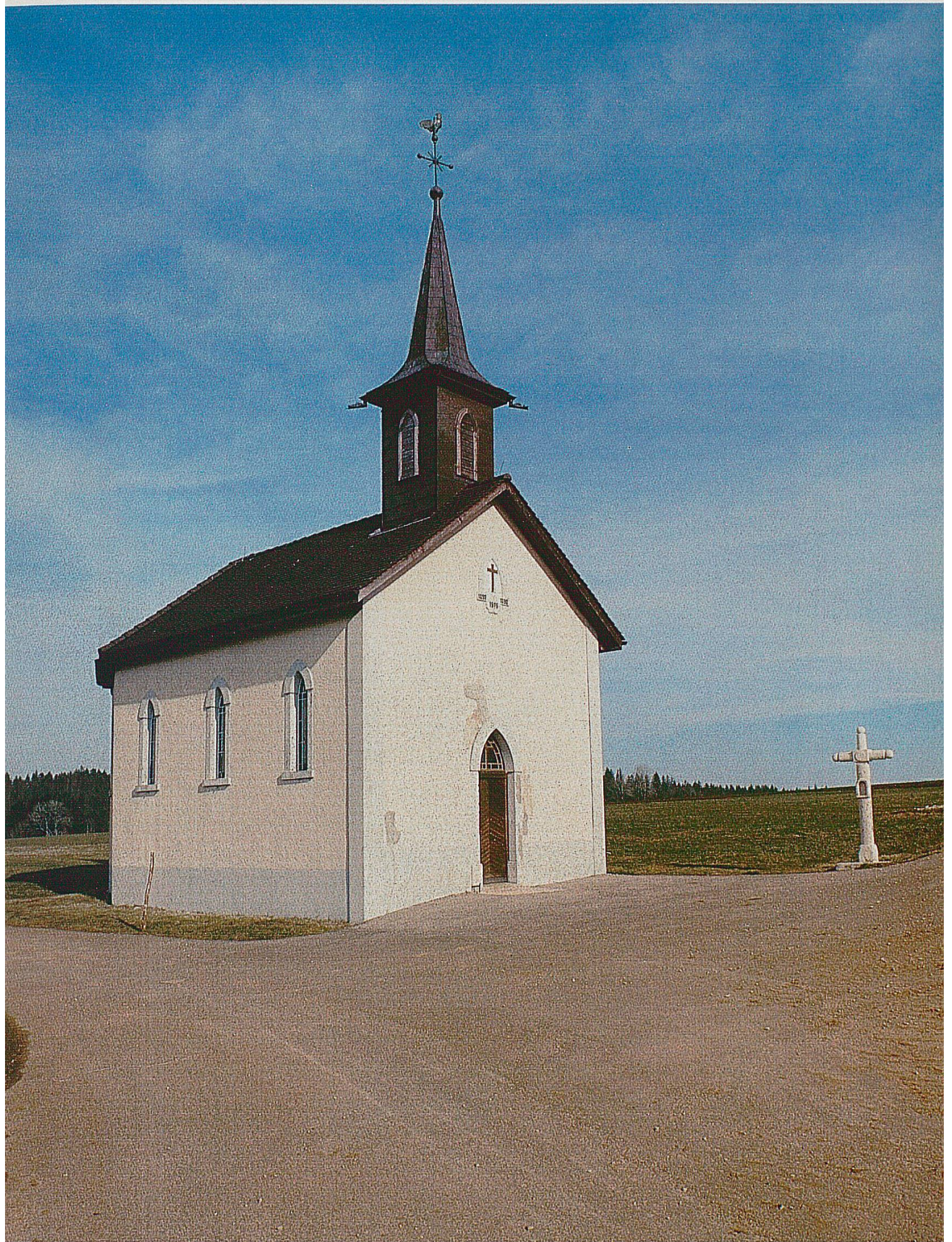
La chapelle de la Bosse