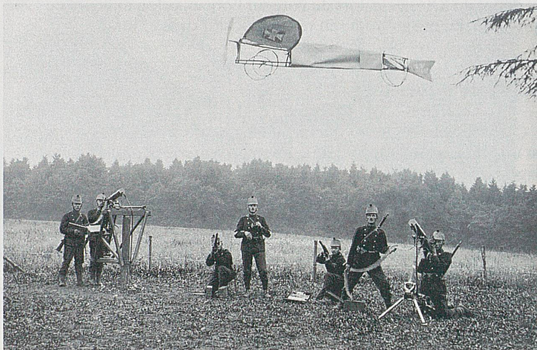
Pendant la Première Guerre mondiale, des soldats suisses s'entraînent au tir DCA, «quelque part en Ajoie». Une sorte de cerf-volant simulant un avion leur sert de cible.

On aimerait également savoir pourquoi les autorités militaires décident de retirer les cartouches, à un moment donné, aux troupes qui gardent la frontière du saillant de Porrentruy. La présentation des accords d'état-major entre Berne et Paris qui prévoient d'importants mouvements de troupes dans les sept districts, en cas d'invasion de la Suisse par l'Allemagne, remplacerait avantageusement la commémoration du caporal Peugeot, le premier mort de la guerre, et l'épisode des uhlands capturés par le landsturm helvétique, en août 1914. La vision du fossé reste trop influencée par les sources passionnées de l'époque. La soixantaine de lignes consacrées à la Deuxième Guerre mondiale ne permettent pas de rappeler les aspects des accords militaires avec la France, du moins ceux qui auraient pu concerner nos régions. Une étude reste à faire sur l'activité des services de renseignement dans le Jura, avant que la légende ne cache trop la vérité. Il semble que les chefs