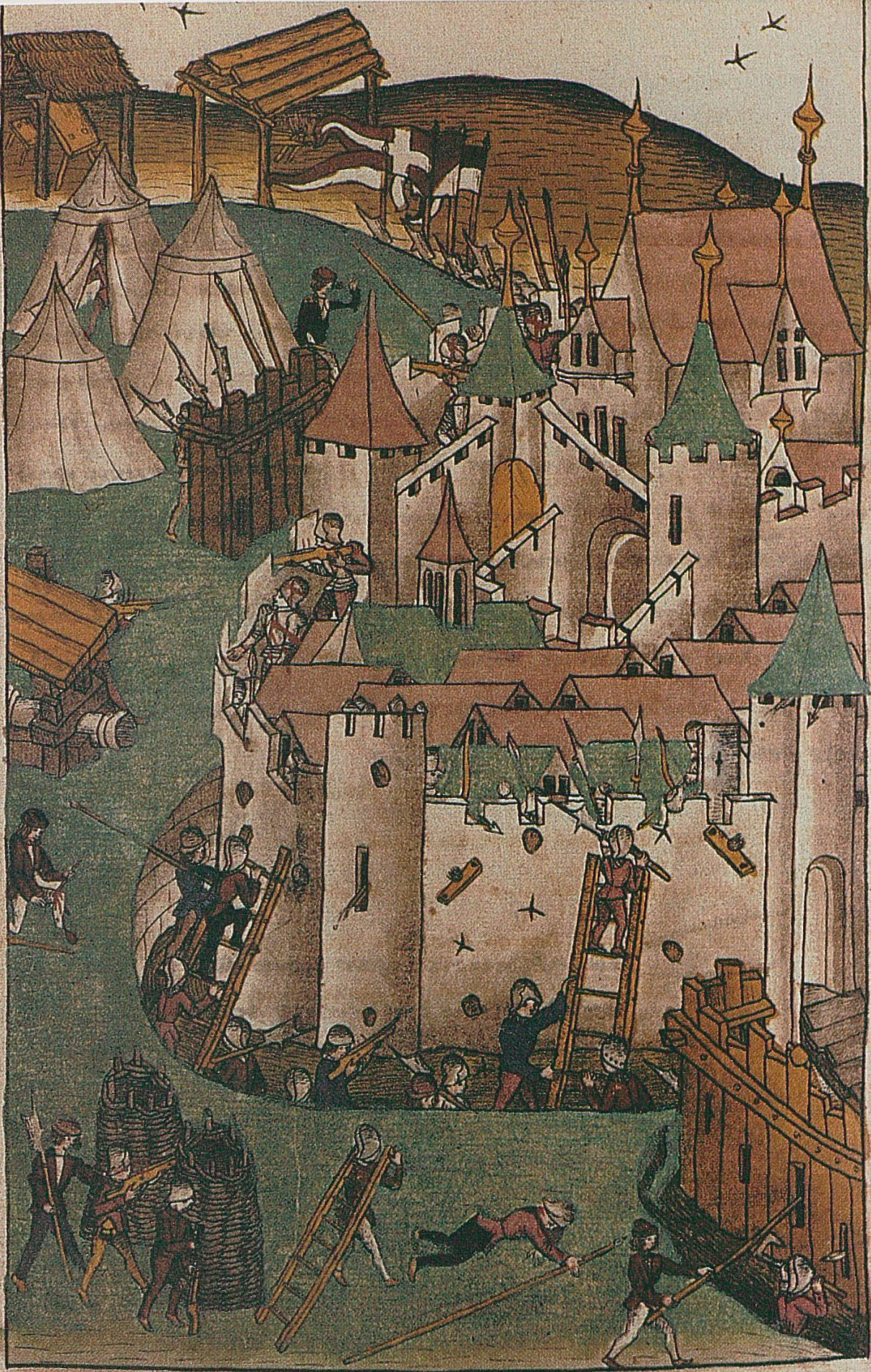
Strasburg / fallonten und an dem gewanten / und