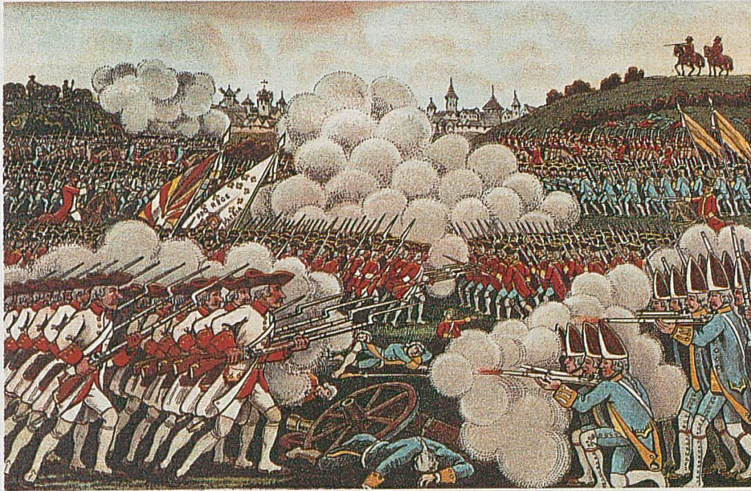
Le régiment d'Eptingen à la bataille de Corbach, le 10 juillet 1760. Il se trouve au centre et se reconnaît grâce aux tuniques rouges de son uniforme et à la double bannière typique dans les régiments suisses au service étranger (Casimir Folletête, Le régiment de l'évêque de Bâle au service de France ).