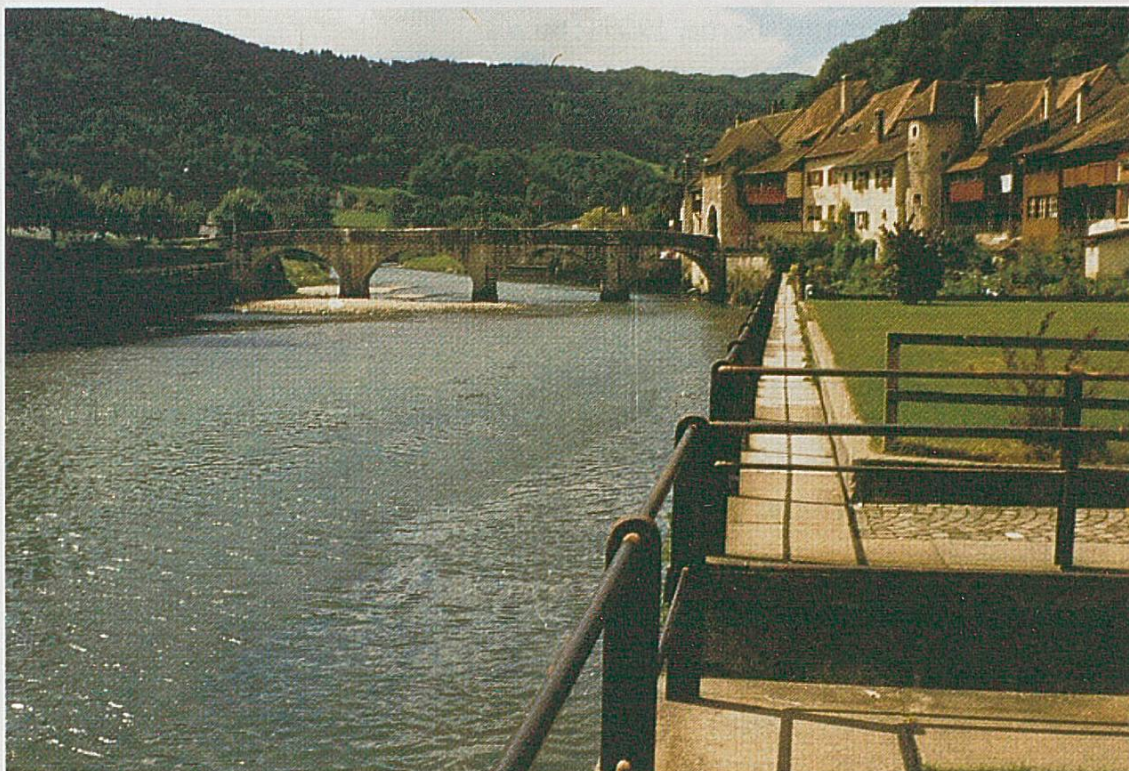
Débit de l'ordre de 10 m 3 /s en août 1988.