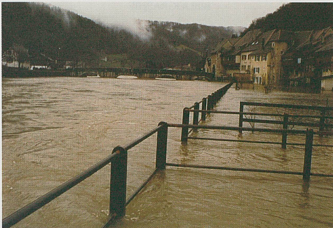
Le Doubs en amont du pont de Saint-Ursanne. Crue du 26 mars 1988 à son maximum, soit 310 m 3 /s.