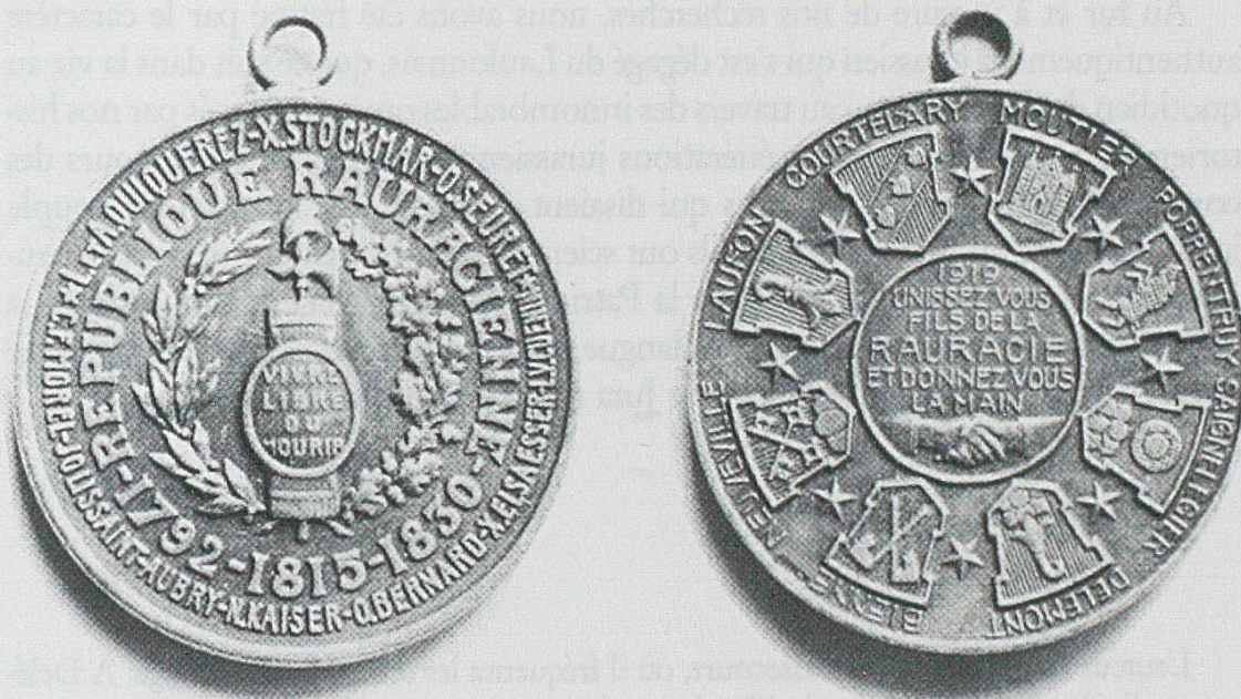
Médaille de bronze frappée en 1919.