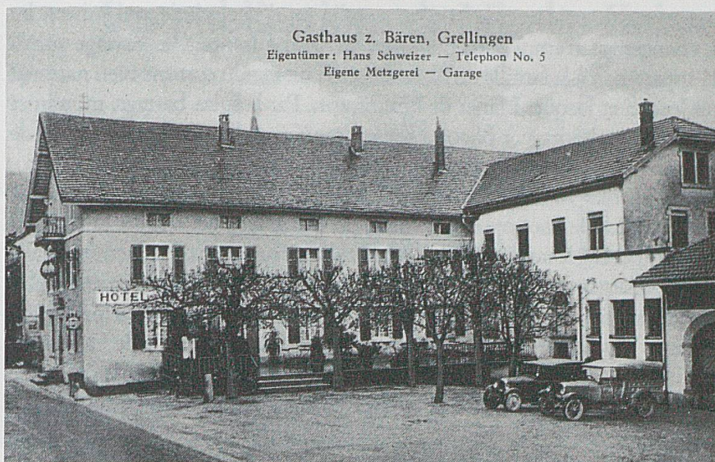
Hôtel de l'Ours à Grellingue (carte postale datée de 1933).