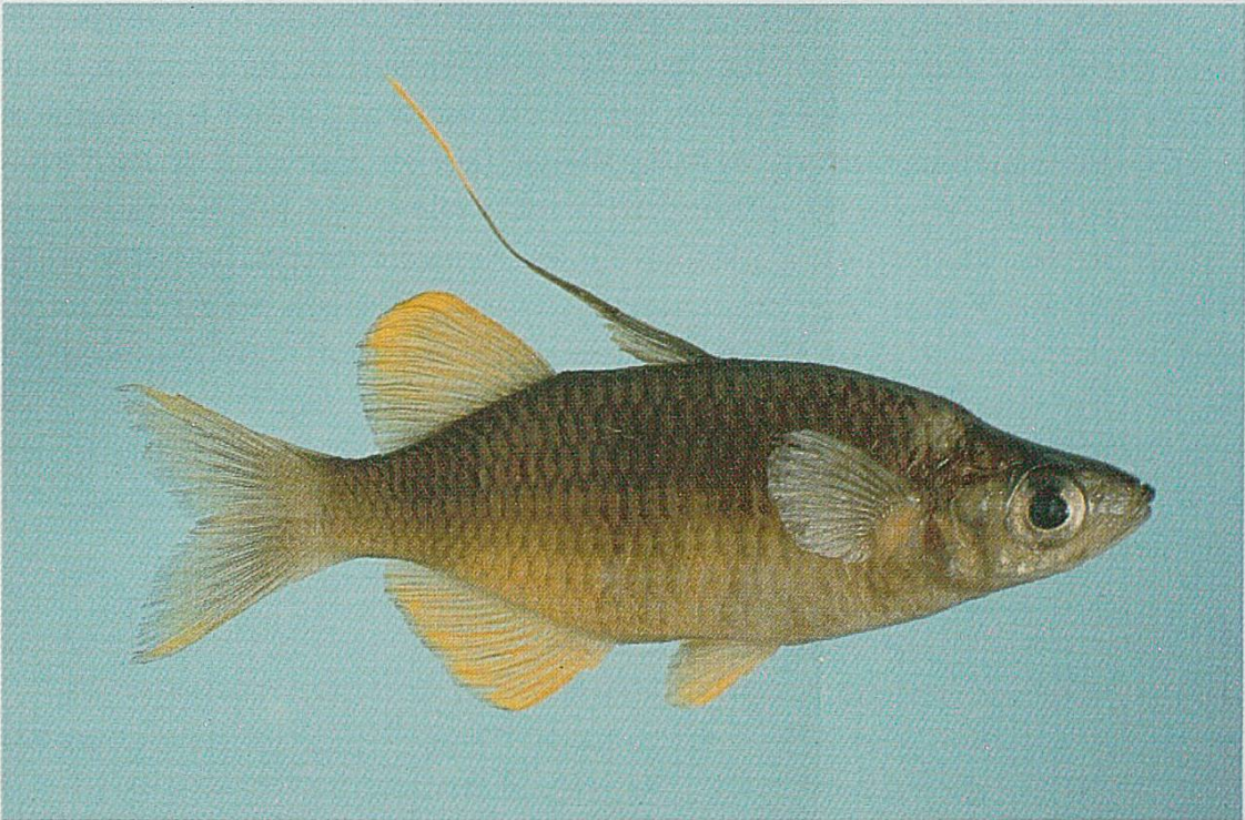
Telmatherina antoniae , lac Matano.