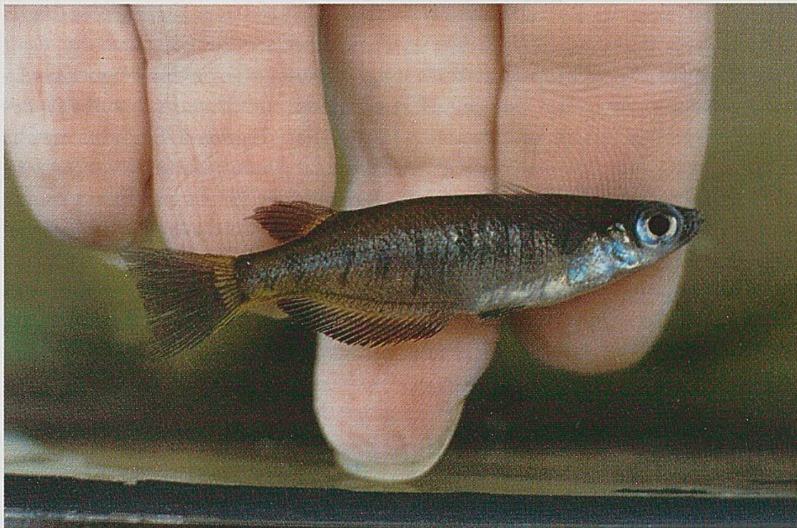
Oryzias matanensis , lac Matano.

Quatre espèces de la famille des Gobiidae ont été récoltées dans le lac Matano. Glossogobius matanensis (Weber, 1913) est le plus grand. Nous avons observé des spécimens de plus de 40 centimètres. Petits, ils sont brun-gris foncé et le corps est couvert de petites taches. Lorsqu'ils grandissent, ils deviennent presque complètement noirs. On trouve cette espèce essentiellement sous les pierres. Pour l'instant, c'est aussi l'espèce de poissons du lac observé dans les plus grandes profondeurs.