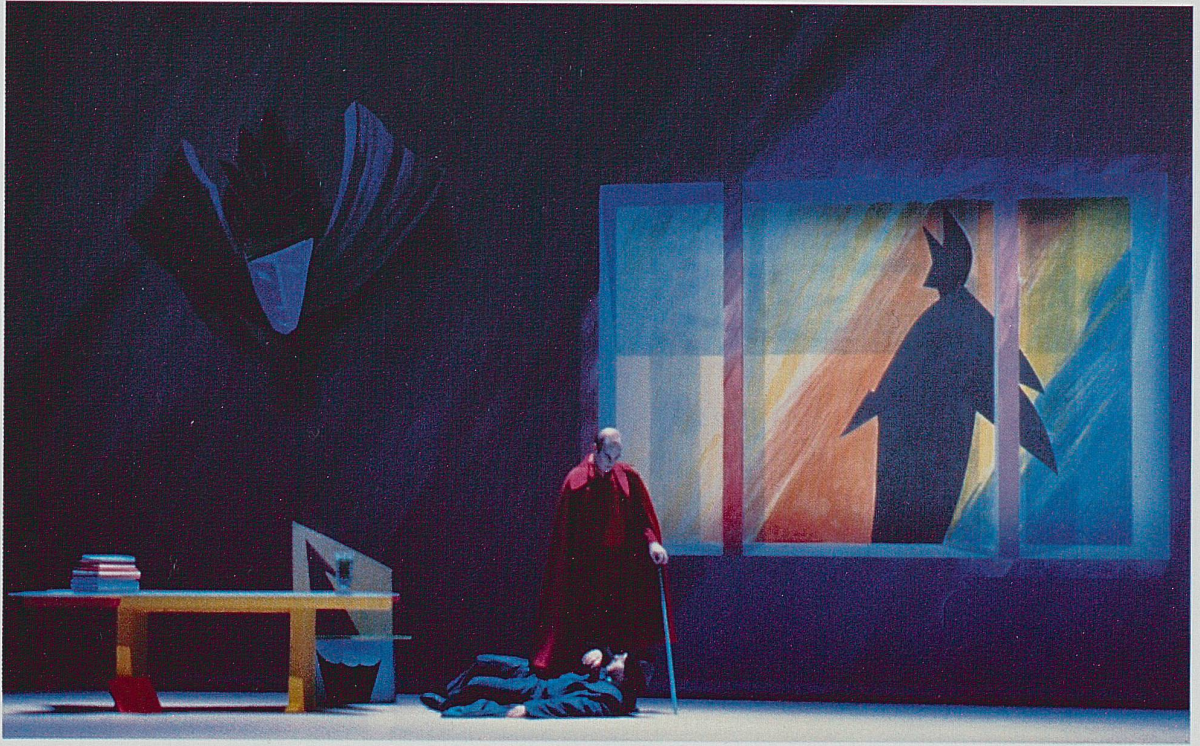
Acte II, scène 1.