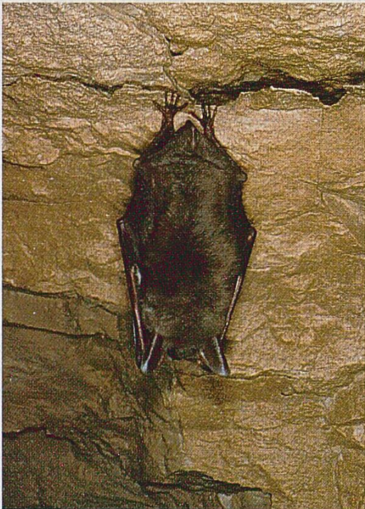
Fig 3 : Grand Murin Myotis myotis.