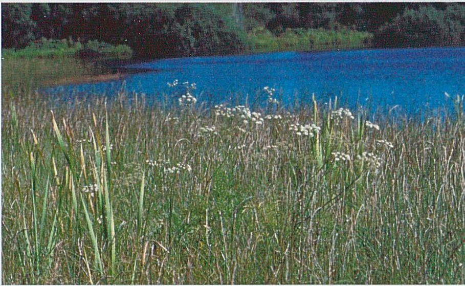
Fig. 3 : Cicuta virosa , Le Bémont, Les Royes, août 2002.