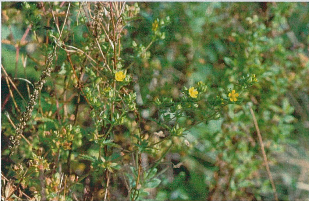
Fig. 6 : Potentilla norvegica , Bonfol, Maitie, septembre 2001.