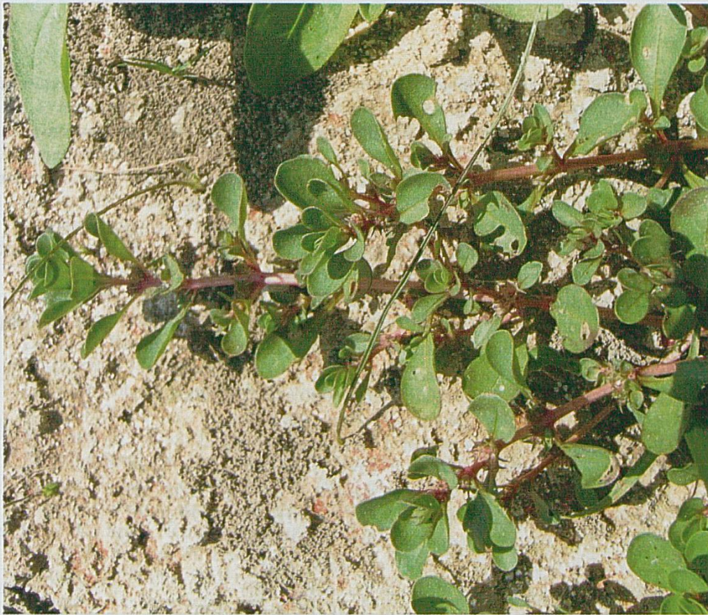
Fig. 5 : Lythrum portula , Bonfol, Champs de Manche, août 2003.