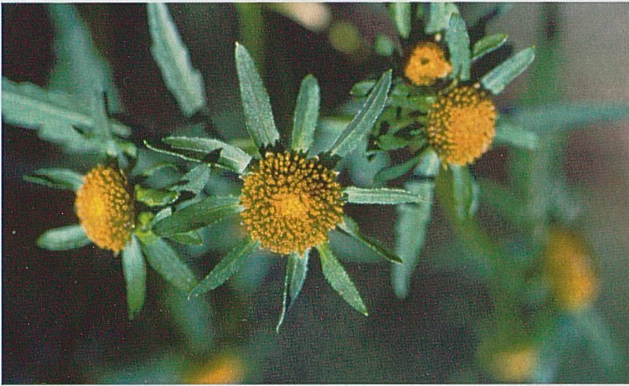
Fig. 2 : Bidens radiata , Bonfol, Etangs Rougeat, août 2003.