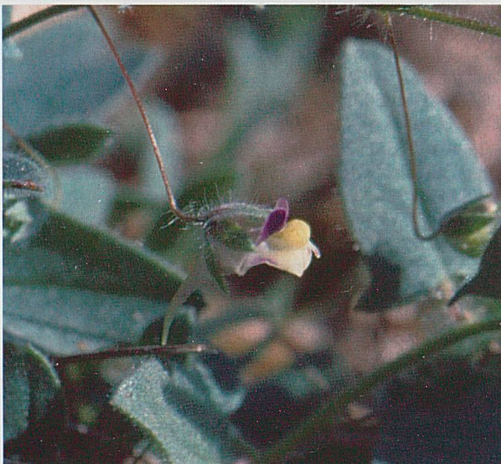
Fig. 4 : Kickxia elatine , Bonfol, août 2003.