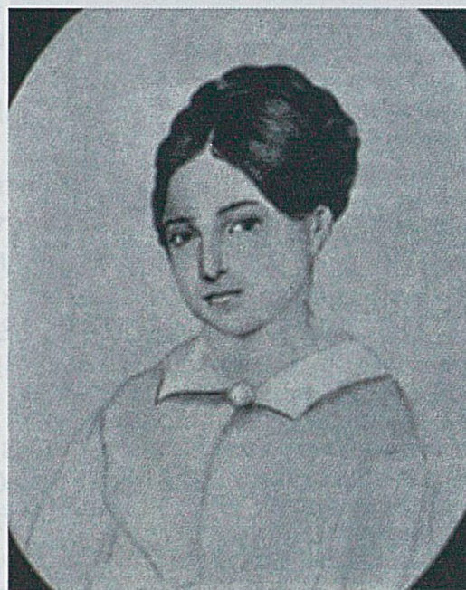
Léopoldine, dessin d'Adèle, sa maman.