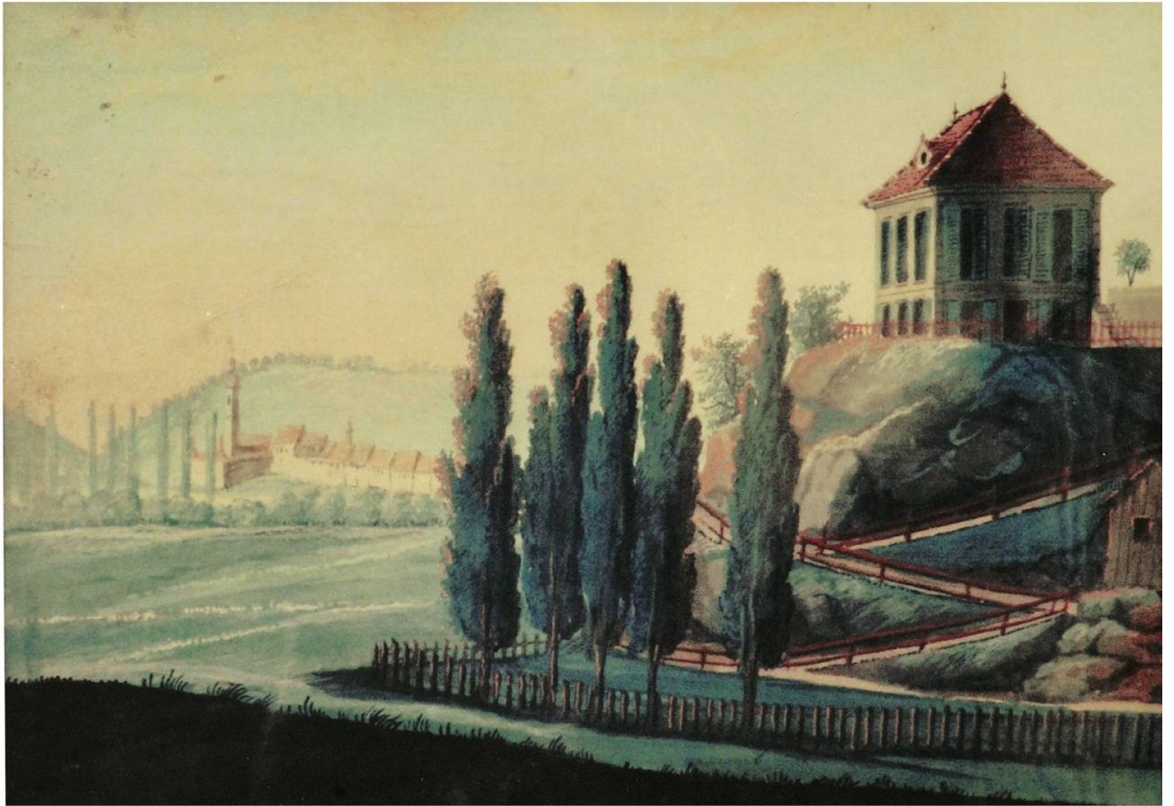
Ill. 4. Le jardin de Bellevue vu du nord, gouache (?), première moitié du XIX e siècle (?), ni signée ni datée. On ignore où se trouve l'original. Une copie (photo en couleurs) se trouve à Gayling-Archiv, Bestand Roggenbach-Archiv, Nachlass Adam Franz Xaver von Roggenbach, sans cote.

l'ermitage, qui contenait une poupée en grandeur nature, habillée en ermite et lisant la Bible. Ce mannequin intensifiait l'atmosphère de recueillement qui devait émaner de l'ermitage et évoquer dans l'âme des visiteurs un sentiment de religiosité et de mélancolie douce 16 . Comme le pavillon chinois, l'ermitage était un élément absolument indispensable d'un jardin paysager et pittoresque.