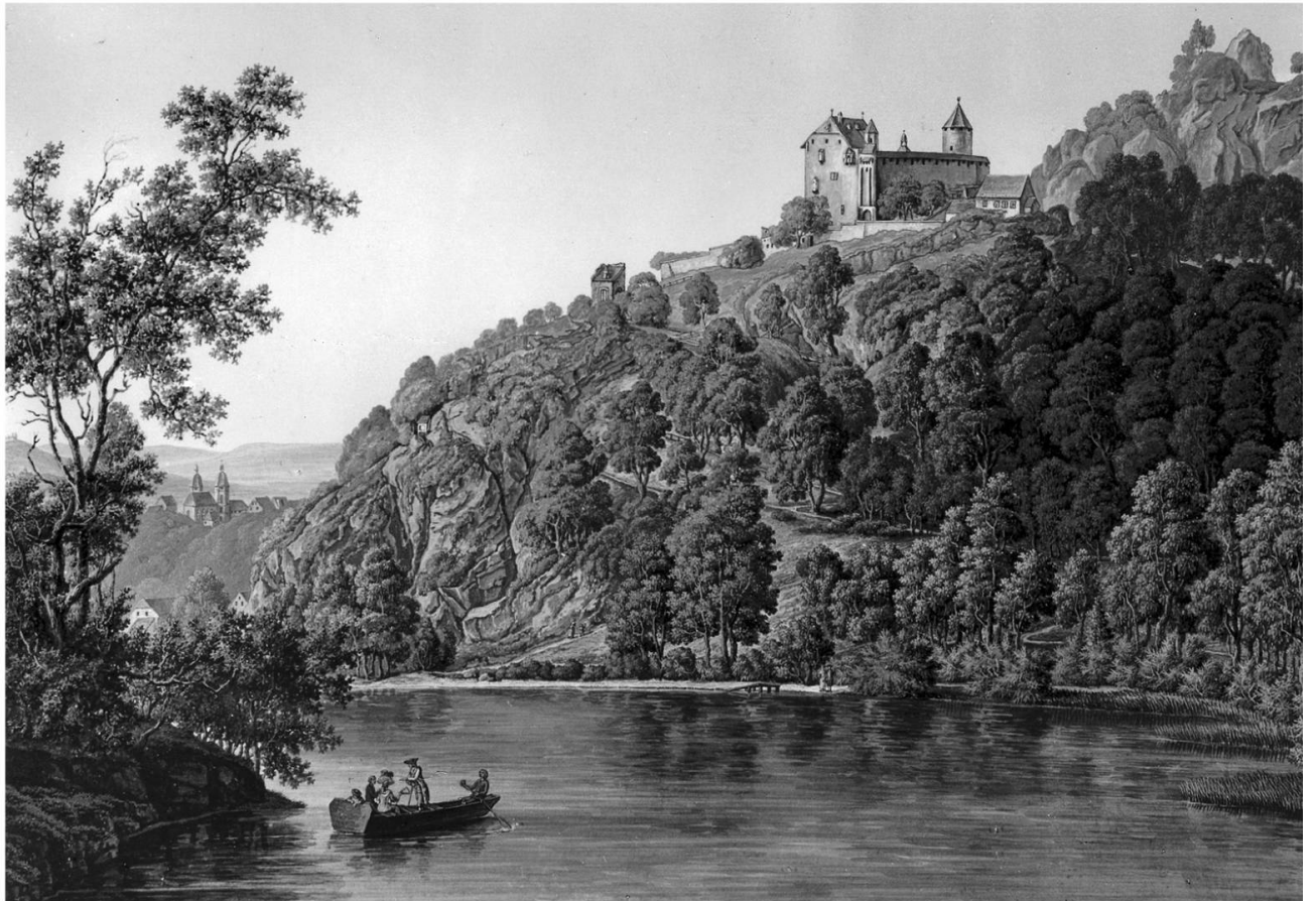
Ill. 5. Seconde vue de la Solitude Romantique près d'Arlesheim dans l'Evêché de Bâle, gravure à l'eau-forte, gouachée, datée de 1787, signée par Johann Baptist Stuntz et Johann Joseph Hartmann. La gravure se trouve à la Collection graphique de la Bibliothèque nationale suisse (Berne), Collection R. et A. Gugelmann, cote : Stuntz B 3.

simplement un parasol chinois car, comme précisé au début de cet article, la présence d'au moins un élément «chinois» était presque obligatoire dans un jardin à la mode des années 1780.