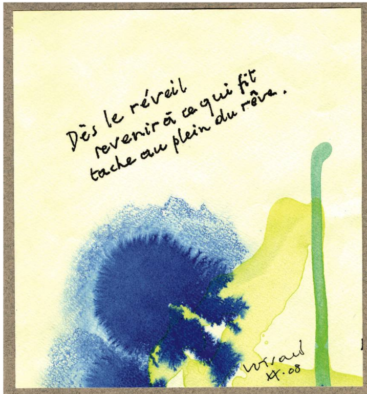
Réveil , aquarelle, 15 x 15 cm, 2008, coll. de l'auteur.