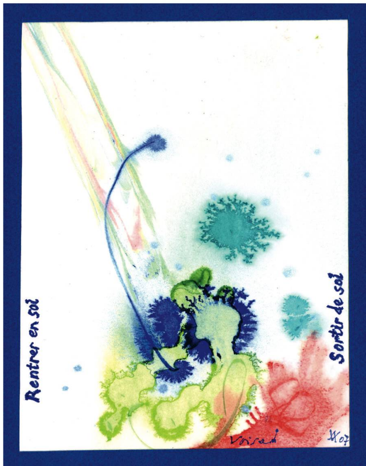
Questionnement , aquarelle 12 x 16 cm, 2007, coll. de l'auteur.