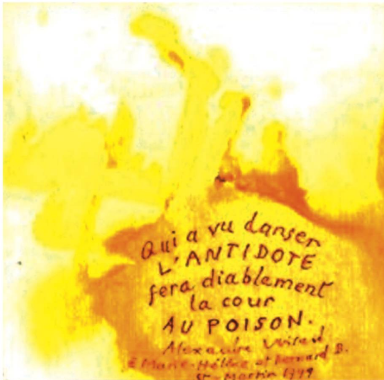
Antidote , aquarelle 13 x 13 cm, 1999, coll. de l'auteur.