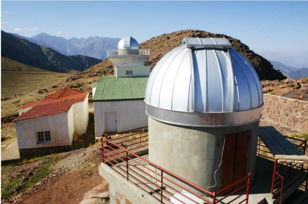
L'Observatoire universitaire de l'Oukaimeden est géré par l'Université Cadi Ayyad de Marrakech et se trouve à 2750 mètres d'altitude. Il abrite la coupole « Vicques Sud » du projet MOSS (au premier plan). En arrière-plan, les plus hauts sommets de la chaîne du Haut Atlas avec notamment les sommets du Toubkal, de l'Ouanoukrim et de l'Afella.