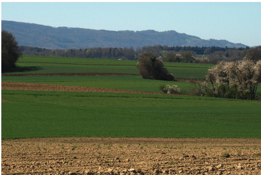
Fig. 4: Paysage et habitat (au premier plan) dans lequel l'Oedicnème criard a fait escale, Bonfol JU, le 7 avril 2011.

Moncevi (577°1/258°0, 470 m), vers 11 h 55, un oiseau bien typé s'envole à mon passage et j'identifie alors sans peine un Oedicnème criard.