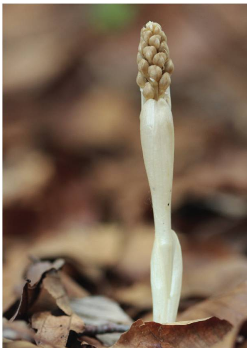
d. Néottie nid d'oiseau ( Neottia nidus-avis )