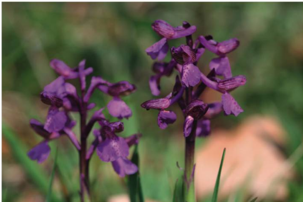
k. Orchis bouffon ( Anacamptis morio )