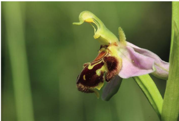
j. Ophrys abeille ( Ophrys apifera )