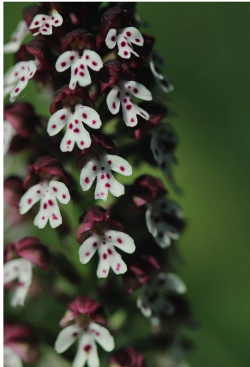
f. Orchis brûlé ( Orchis ustulata )