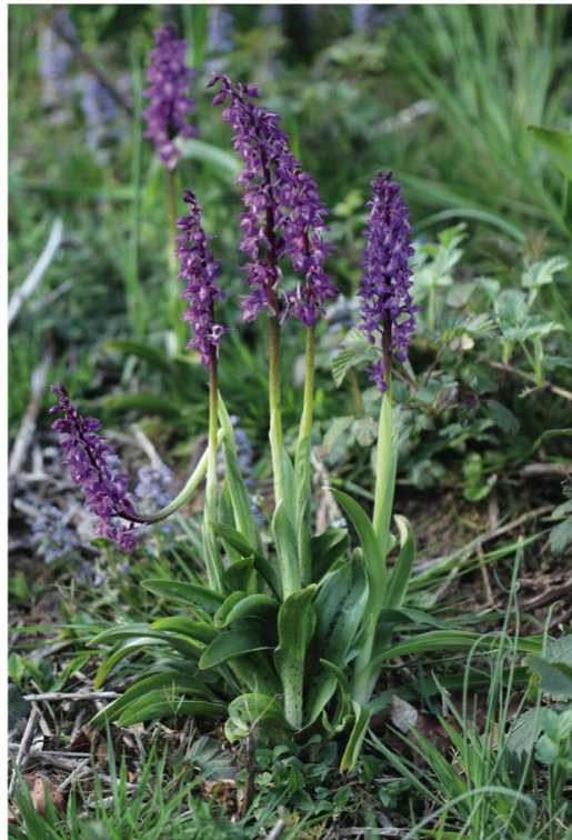
h. Orchis mâle ( Orchis mascula )