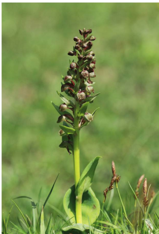
g. Orchis grenouille ( Coeloglossum viride )