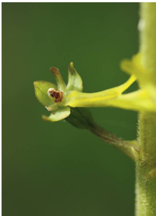
c. Listère ovale ( Listera ovata )