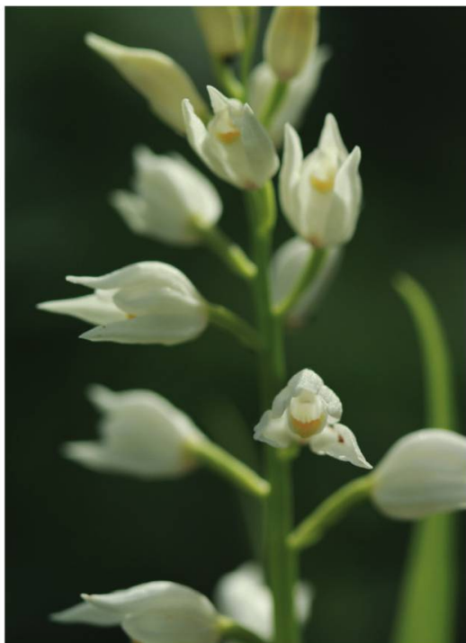
a. Céphalanthère à longues feuilles ( Cephalanthera longifolia )