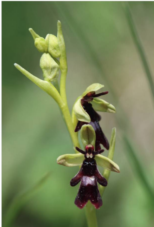
e. Ophrys mouche ( Ophrys insectifera )