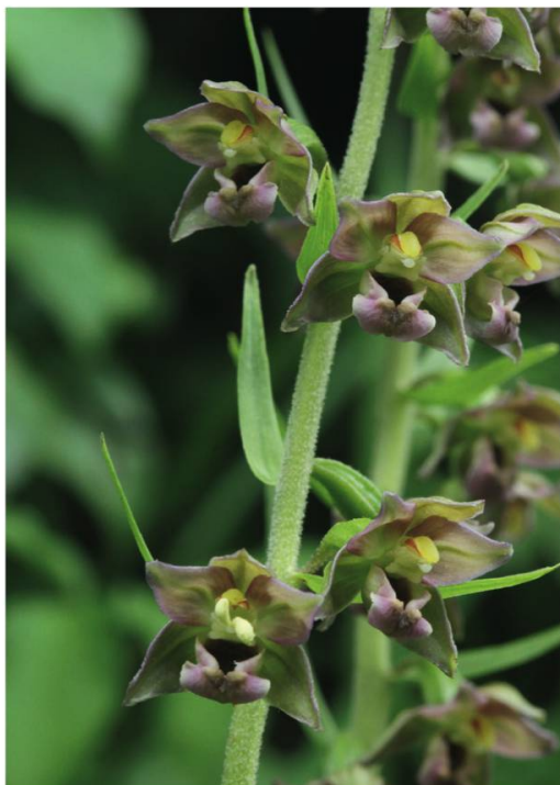
b. Epipactis à larges feuilles ( Epipactis helleborine )