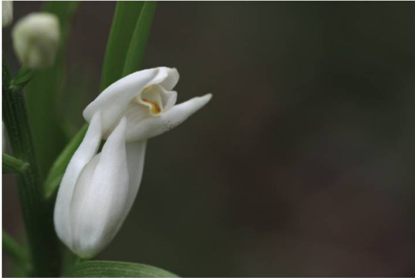
i. Céphalanthère à longues feuilles ( Cephalanthera longifolia )