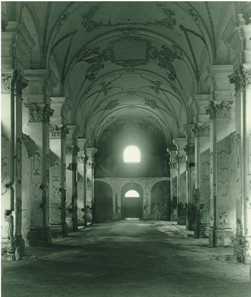
Fig. 3: Vue intérieure de l'abbatiale sur la nef et l'entrée, prise depuis le fond du chœur (ArCJ, 90 J 1).

Ainsi, plusieurs indices tendent à montrer que l'absence de réponse gouvernementale trouve son origine dans la perplexité des services de