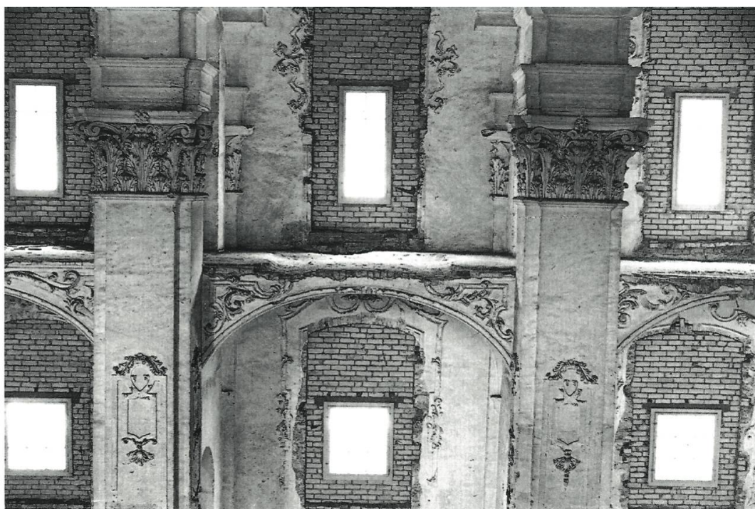
Fig. 2: Fenêtres murées (photographie A. Wyss, reproduite dans WYSS Alfred, DE RAEMY Daniel, L'ancienne abbaye de Bellelay. Histoire de son architecture , s. 1. (Intervalles), 1992, p. 99).

Pourtant, ce comité ne parviendra pas à dépasser ses objectifs les plus modestes. On devine, en feuilletant les diverses sources disponibles, que le