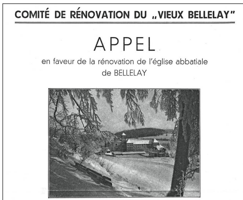
Fig. 5: Appel à contribution en faveur de la rénovation de l'abbatiale de Bellelay, 1956 (AAEB, J 17/1).

Le 1 er juillet 1961 aura lieu l'inauguration de l'église rénovée. Elle sera destinée à la vie culturelle et devra être un lieu de rassemblement, selon le compromis prudemment imposé par Virgile Moine. Le chemin parcouru a été parsemé d'embûches révélatrices: