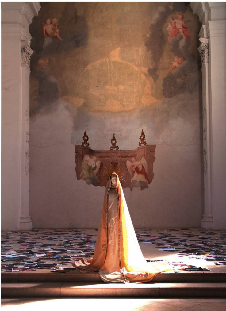
Fig. 2: Catherine Gfeller, Mannequin vêtu de Madone, réalisé dans le cadre de l'installation Processions croisées , 2010 (© Catherine Gfeller, Prolitteris Zurich).

est le cas notamment de Catherine Gfeller, photographe et vidéaste née à Neuchâtel en 1966, qui a réussi à s'imposer lors de la première mise au concours publique de l'exposition d'été 2009 face aux cinquante et un autres concurrents. Dans son rapport final sur la procédure de sélection, le jury devait conclure : «Les multiples facteurs d'intégration, à l'esprit du lieu, au contexte architectural, à l'environnement, ont constitué les principaux critères de jugement. [...] Le jury a finalement choisi le projet "Procession croisée" de Catherine Gfeller pour sa qualité et sa force d'intégration à l'architecture de l'abbatiale. Ce projet ponctue, de l'entrée jusqu'au chœur, la succession des espaces et renforce spirituellement et matériellement la lisibilité de la composition architecturale du lieu 47 . » La figure de la Vierge, à laquelle fut très tôt dédiée l'église de Bellelay 48 , constituait le leitmotiv de l'exposition de Gfeller. Au-dessus du tabernacle, qui a été vendu après la sécularisation, se trouvait jadis une statue de la Vierge Marie, flanquée des deux anges encore conservés sur la peinture murale 49 . À l'intérieur du