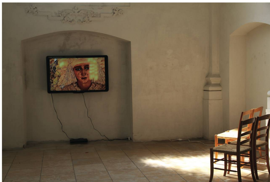
Fig. 3 : Catherine Gfeller, Le Dit des Vierges , Vidéo, DV Pal, 13 min 19 s, 2010 (© Catherine Gfeller, Prolitteris Zurich).

Cinq ans auparavant, l'artiste Philippe Fretz, né à Genève en 1969, avait suspendu trois caissons lumineux entre les pilastres des trois travées, sur lesquels on pouvait lire quatre mots en néon blanc : «merci», «pardon» et «au secours!». Il s'agit des trois grandes composantes de toute prière : l'action de grâce, la demande de rédemption des péchés, l'imploration du salut.