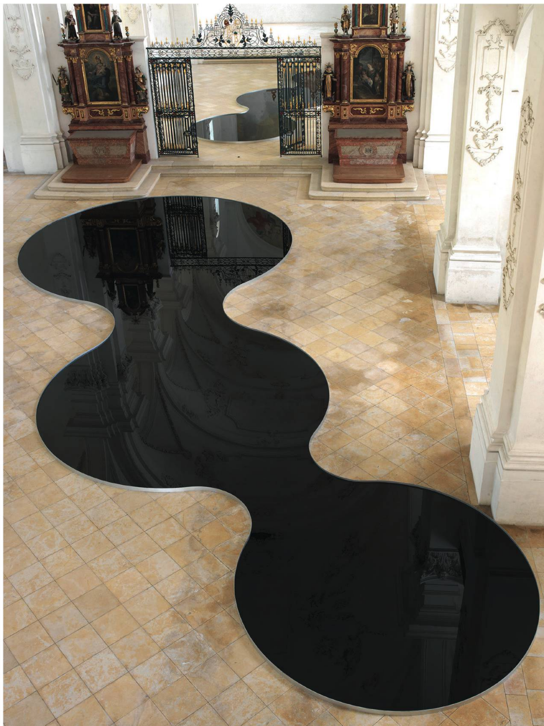
Fig. 5: Romain Crelier, La mise en abîme , récipients circulaires reliés entre eux et remplis d'huile de vidange de moteur, 2013.