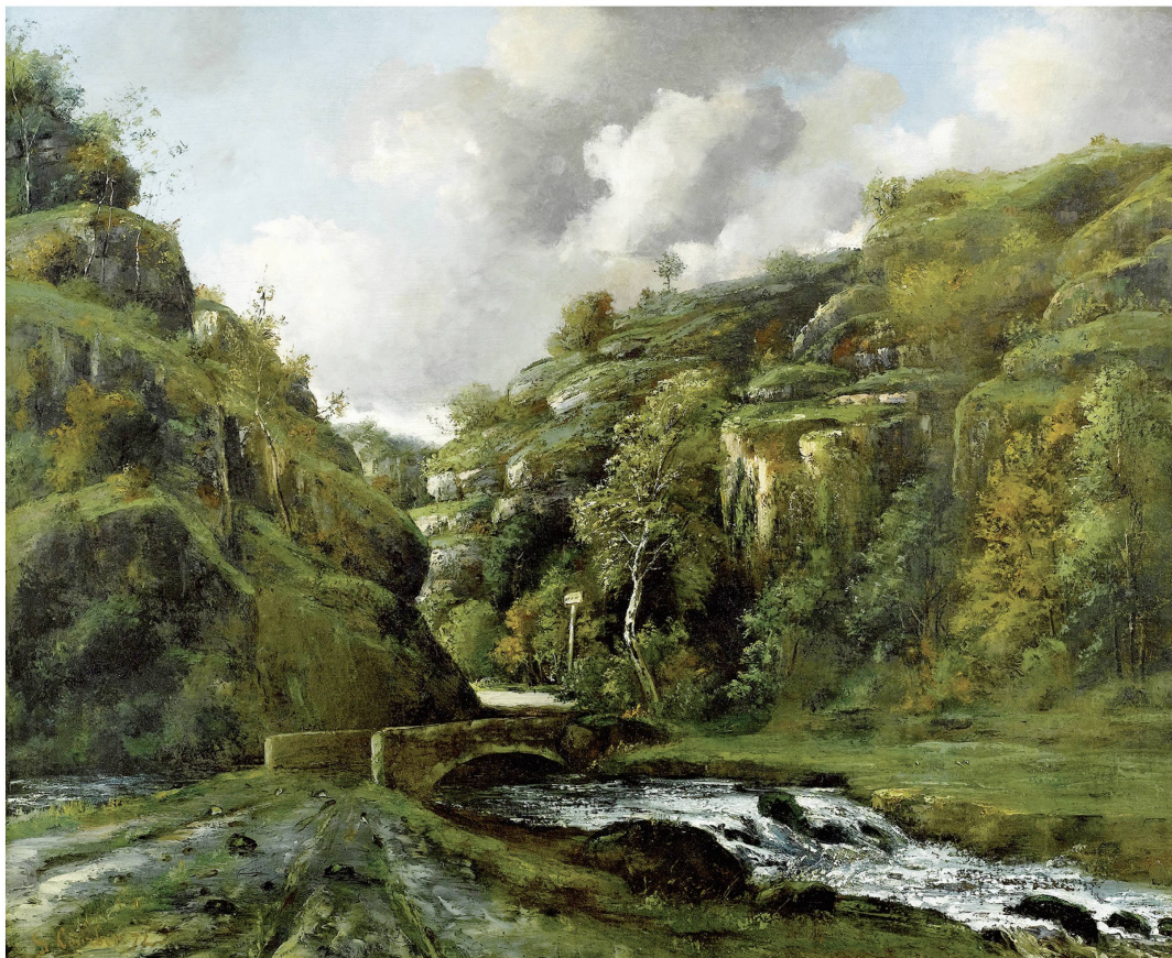
Fig. 1 : Gustave Courbet, Paysage du Jura , 1872. Huile sur toile, 104 × 129 cm. Delémont, musée jurassien d'Art et d'Histoire, dépôt de la collection cantonale des beaux-arts.

En été 2017, le Gouvernement de la République et Canton du Jura a accepté, sur la base d'un rapport en authenticité et provenance et d'un avis de droit 1 , le legs d'un tableau de Gustave Courbet (1819-1877). Inconnue des spécialistes, absente des catalogues raisonnés,