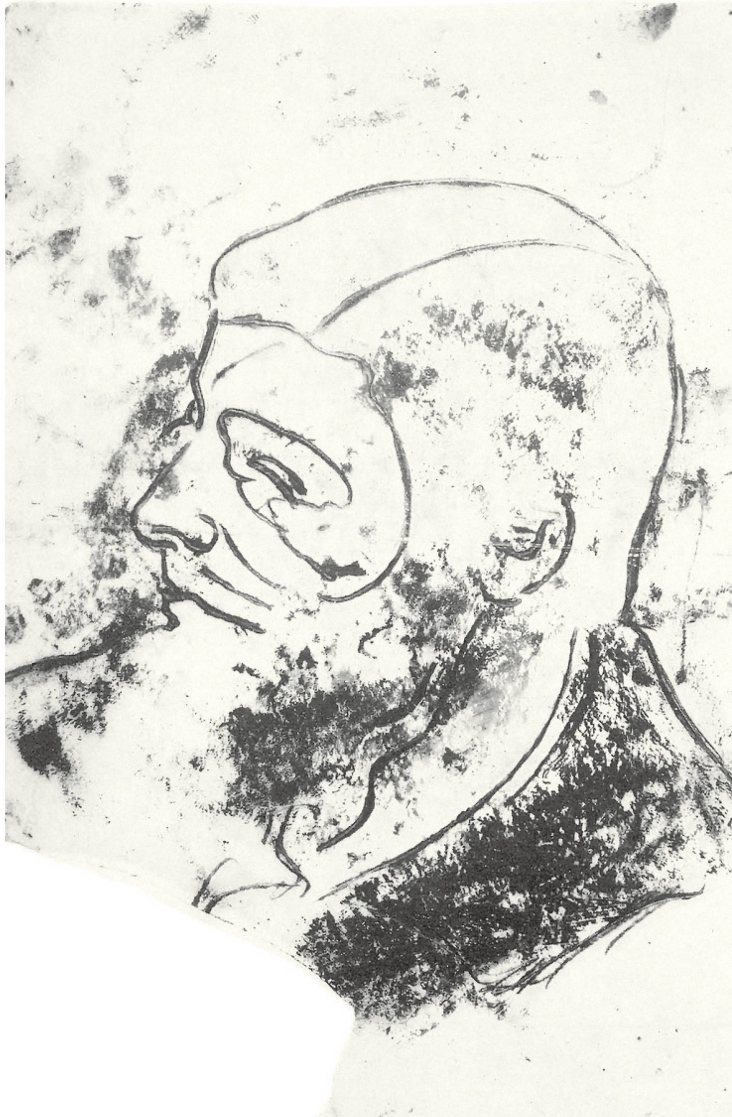
Fig. 5: Gustave Courbet, Autoportrait , 1854. Encre et fusain (?) sur papier-calque, 45 × 29,5 cm. Collection privée.

ne m'oblige ni à employer un procédé quelconque, ni à me servir d'un crayon plutôt que d'un simple morceau de craie 18 ». Le dessin préparatoire directement réalisé au pinceau est également documenté par une série de trois panneaux de bois pour la Saga de la conférence sur lesquels Courbet a réalisé un tracé à l'huile blanche et qui peuvent être qualifiés de dessins préparatoires, puisque ces panneaux étaient destinés à être soit gravés, soit peints 19 .