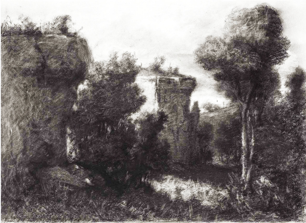
Fig. 3 : Gustave Courbet, Paysage des Essarts-Cendrins , vers 1847. Fusain, crayon noir, crayon au graphite et estompe sur papier gris clair préparé, 44,5 × 50,2 cm. Boston, Museum of Fine Arts.

indéniables lorsqu'on s'attarde sur l'approche haptique de la technique du dessin, qualité tactile qui se traduit par d'innombrables grattages dans les noirs et montre que la pratique du fusain chez Courbet s'assimile à celle, plus matérielle et engagée encore, de la peinture 12 . Aussi, l'ébauche préparatoire, du moins dans le registre du paysage, reste absolument exceptionnelle, quand bien même le dessin joue un rôle dans le processus pictural du maître, comme cela a notamment été démontré au sujet du célèbre Atelier du peintre (figure 4) dans lequel il réunit tout un aréopage d'amis et de connaissances en vue de proposer une « allégorie réelle déterminant une phase de sept années de ma vie artistique 13 ».