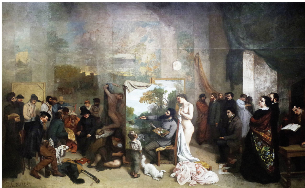
Fig. 4: Gustave Courbet, L'Atelier du peintre , 1854-1855. Huile sur toile, 361cm × 598 cm. Paris, musée d'Orsay.