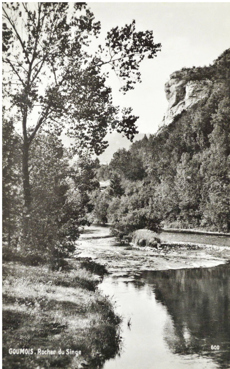
Fig. 7 : Carte postale photographique du rocher du Singe à Goumois.