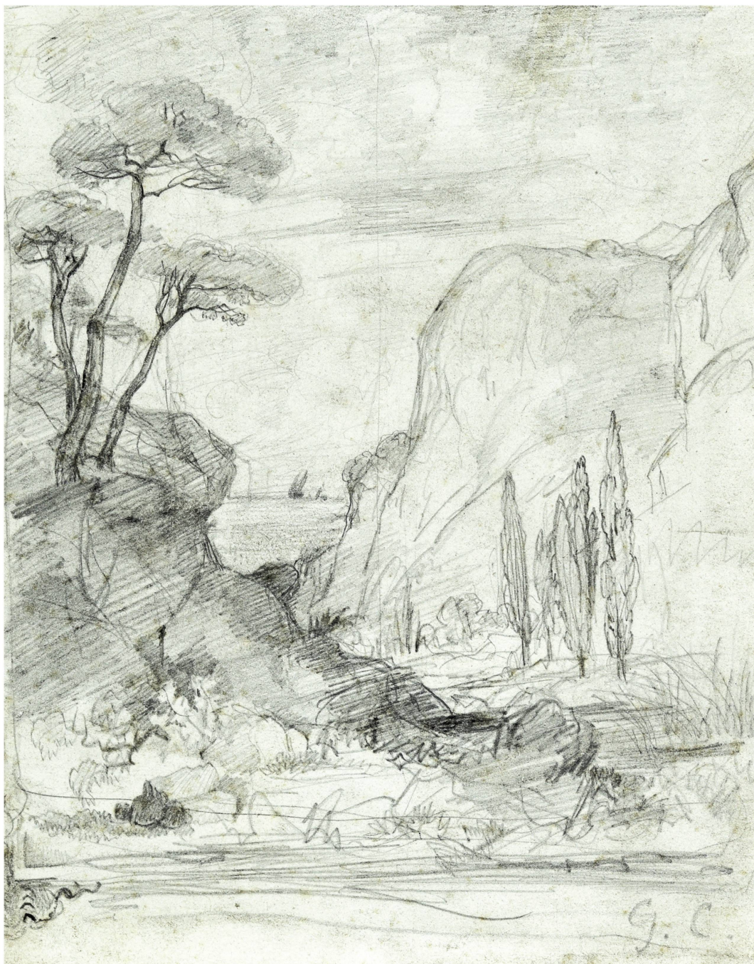
Fig. 2: Gustave Courbet, Paysage de l'Hérault , 1854 ou 1857. Crayon au graphite sur papier, 21,5 × 17 cm. Collection privée.

peinture sont rarissimes, ce qui est tout l'inverse des autoportraits dessinés, par exemple, dont il existe souvent un pendant pictural. Le Paysage des Essarts-Cendrins du musée de Boston (figure 3) peut toutefois être rattaché à plusieurs peintures des environs d'Ornans exécutées par le maître. Les qualités d'œuvre d'art autonome de ce dessin sont d'ailleurs