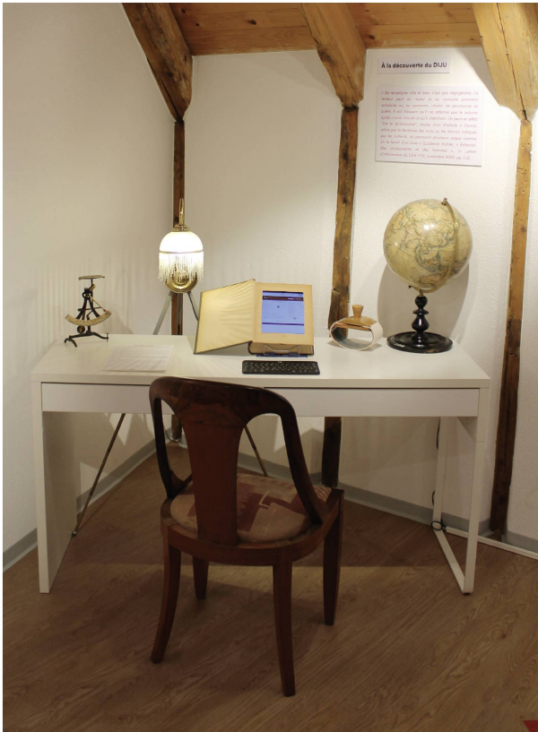
L'espace didactique de l'exposition donnant un accès au DIJU