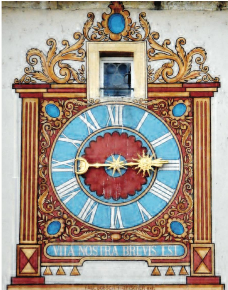
VITA NOSTRA BREVIS EST. Notre vie est brève.

La Porte de France, autrefois Porte du Bourg, fut reconstruite en 1563, transformée en 1744 et rénovée en 1942-1943. Ce bâtiment est la seule porte restante de la ville de Porrentruy, mais son cadran peint est récent ; son horloge, quant à elle, date de 1714.