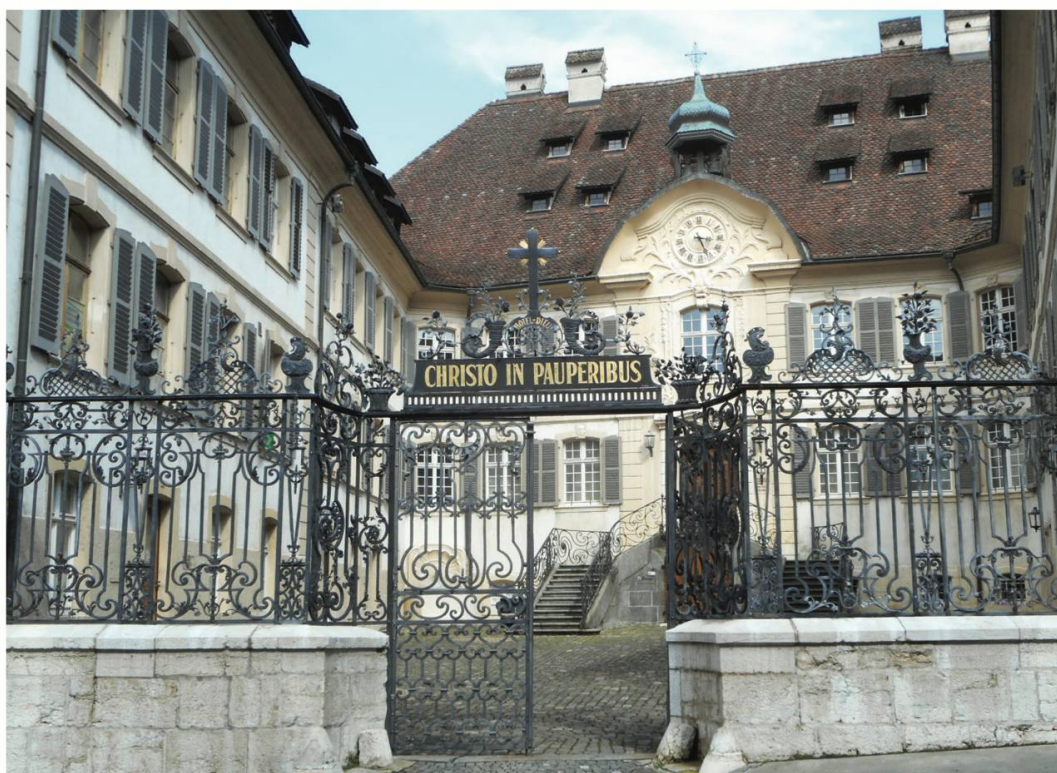
CHRISTO IN PAUPERIBUS. Christ parmi les pauvres.