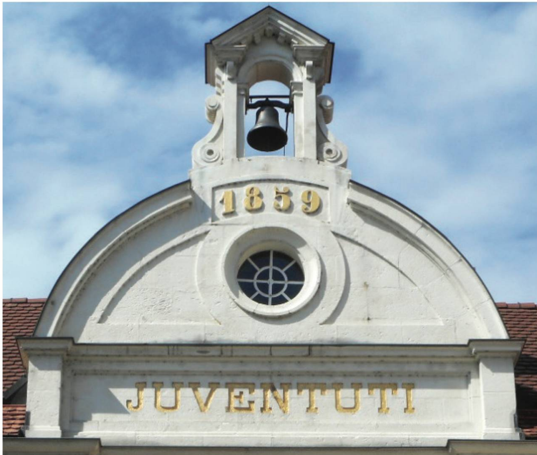
JUVENTUTI. À la jeunesse .