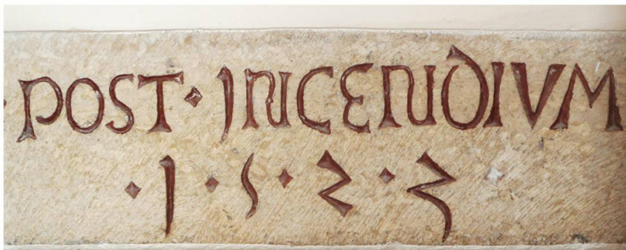
Post-Incendium. Après l'incendie.

C'est la plus ancienne inscription 1 en latin de Porrentruy; elle est située à la rue des Baïches n° 13, vis-à-vis du café des Trois-Tonneaux, au premier étage.