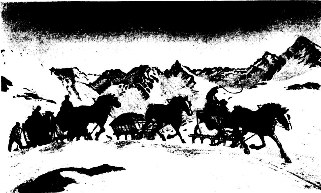
Berninapost. P. R. Berry, pinx, Kunsthauus Chur, mit gütiger Erlaubnis von Dr. Berry, St. Moritz, reproduziert.

Kriegsausbruch im Herbst 1939, als ich mit meiner Gebirgsartillerie-Abteilung vor einem voraussichtlich längeren Winterdienst stand. Da stellten wir uns die Aufgabe, diese Seite des Winterdienstes in Angriff zu nehmen und die notwendigen Erfahrungen zu sammeln. Das Arbeitsprogramm umfasste folgende Punkte: