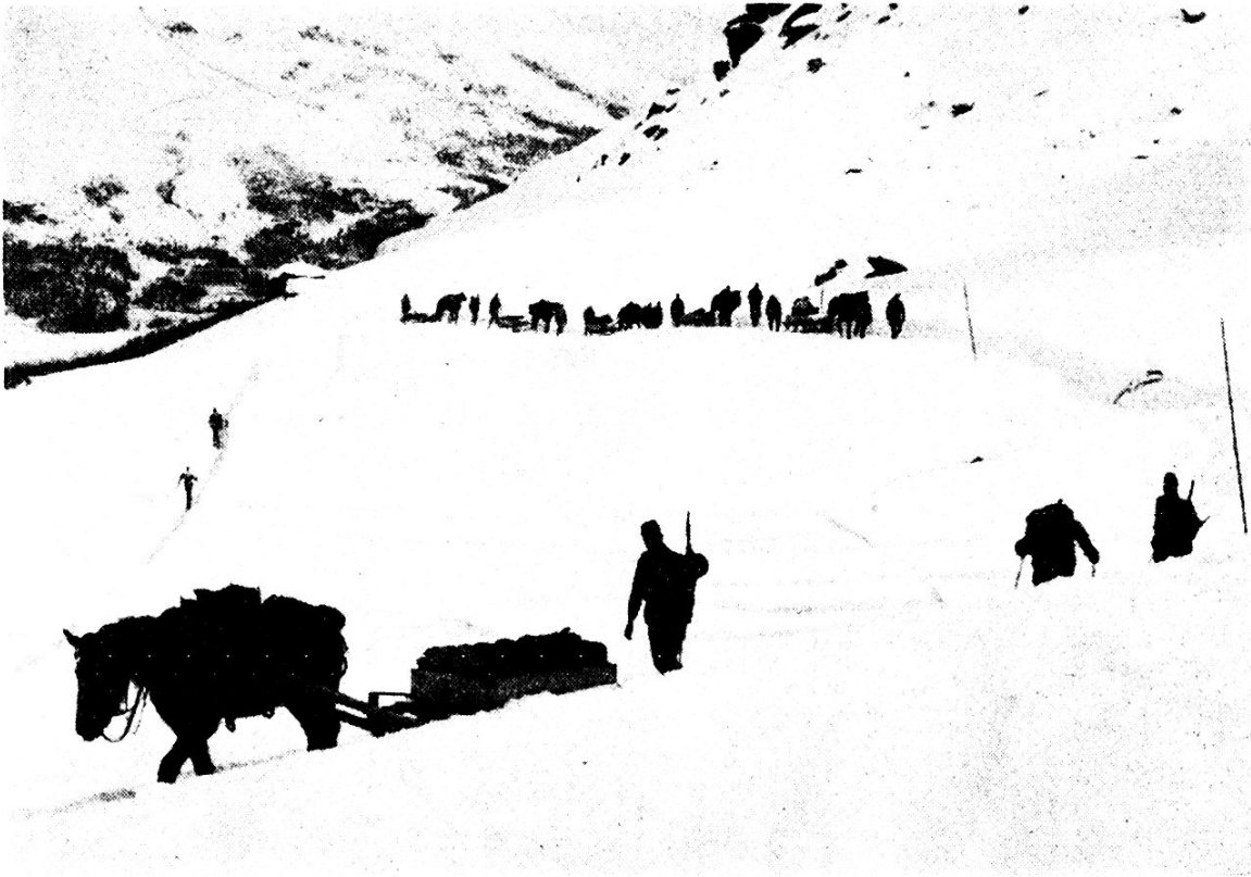
Marschierende Kolonne. Gewohnte Pferde gehen am ruhigsten, wenn man sie gar nicht führt, sondern der Führer einfach vorausgeht.

werke zugeteilt, und im kommenden Winter sollen Uebungskurse mit diesem neuen Material durchgeführt werden. Wir müssen so weit kommen, dass jede Gebirgstruppe ihr Wintermaterial für Batterien und Trains bereit hat. Unterlagskufen für Räderfuhrwerke sind und bleiben Notbehelfe. Sie sind sicher wertvoll im Mittelland und in den Vorbergen für den Verkehr auf Strassen und für die Uebergangszeit im Gebirge. Es kann schon im September und Oktober der Fall eintreten, dass über Nacht ein halber Meter Schnee fällt auf einem Pass. Mit den Unterlagskufen bringe ich meine Fuhrwerke trotzdem auf der Strasse weiter, und wenn tags darauf der Föhn wieder die weisse Herrlichkeit wegfegt, so rollen die Räder wieder. Aber für den Dienst im eingeschneiten Hochgebirge, abseits von grossen Strassen und auf Pässen ist der einspännige Bergschlitten das einzig brauchbare Fuhrwerk.