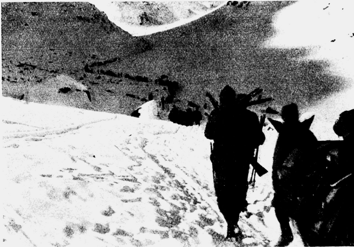
Fertiger Weg in ebenem Gelände. Er darf nicht als Graben angelegt werden, sondern soll so hoch liegen, wie der Schnee liegt.

starke Tiere und das Vorpferd soll oft abgelöst werden. Durch die so entstandene Spur folgen die Pferde mit den leeren Schlitten, welche durch die Schlittengeleise die Wegbreite ergeben. Ihnen folgt ein Schauflerdetachment , das die getretenen Spuren mit Schnee einfüllt. In ebenem Gelände wird der Schnee beidseitig eingestochen, damit eine ebene Fahrbahn entsteht. Am Hang wird nur bergseitig der Schnee eingestochen. Er darf aber nicht ausgeworfen, sondern nur umgelegt werden, damit auch am Hang eine im Querprofil ebene Fahrbahn entsteht.