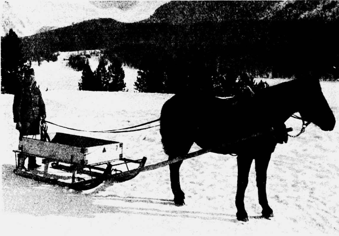
Schlittenbespannung im Einspanner mit Bündnergeschirr.

gebirgsverfahren sein und sich gut ins Gelände einföhlen können. Die richtige Anlage der Weglinie kann über das Gelingen des Unternehmens entscheiden. In langem Anstieg sollte ein Gefälle von 10—12 % nicht überschritten werden. Die durch geringeres Gefälle länger werdende Wegstrecke wird wettgemacht durch ein ruhigeres Arbeiten der Pferde und damit fließendes Marschieren der Kolonne. Meistens ist die Anlage der Piste bedingt durch die Möglichkeit der Anlage von Kehrplätzen. Der Auswahl der Kehrplätze ist volle Aufmerksamkeit zu schenken. Durch ungeschickt ausgewählte Kehrplätze können während des Marsches unliebsame Stockungen entstehen. Das Abstecken der Weglinie braucht etwelche Uebung und Erfahrung. Das Gefälle der Weglinie muss mit einem Sitometer kontrolliert werden. Mit Stöcken, Zweigen oder ähnlichen Zeichen ist die abgesteckte Linie zu sichern.