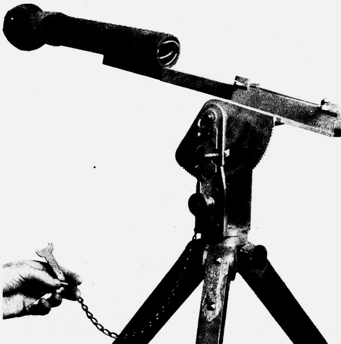
Abb. 1: Raketengestell schweiz. Ordonnanz mit aufgelegter Schussrakete.

Die Verordnung unterscheidet zwischen den Batterien des Bundesauszuges zu 8 Raketengestellen und den Batterien der Bundesreserve zu 4 Raketengestellen. An Munition wurden Schussraketen, Wurfraketen, Kartätschraketen, Brandraketen und Leuchtraketen mit und ohne Fallschirm zugeteilt, also ein recht reichhaltiges Assortiment.