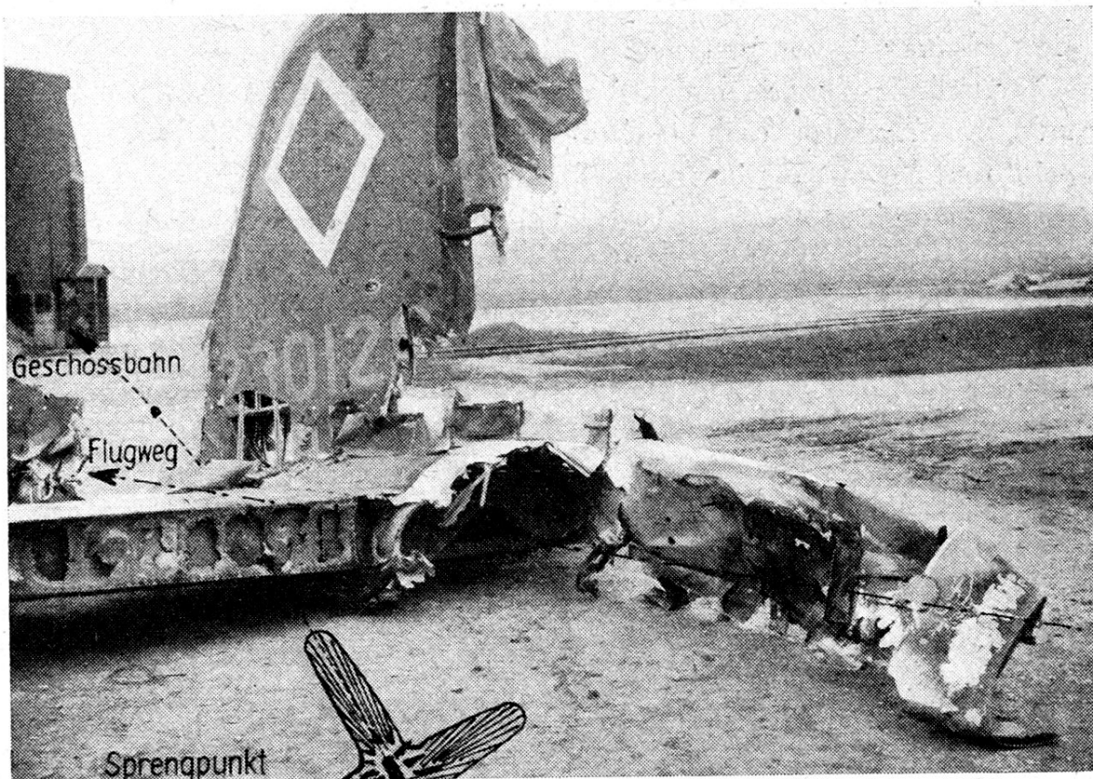
Abb. 1. Wirksamer 7,5-cm-Flabtreffer in Flugzeugnähe. Mit eingezeichneter Geschossbahn, Flugweg und Splitterverteilung.

Wirksame Treffer sind bei kleinkalibrigen Waffen nur solche, die das Flugzeug effektiv treffen und durch die nachfolgende Wirkung der Sprengladung einen vitalen Teil des Flugzeuges zu zerstören vermögen. Schwere