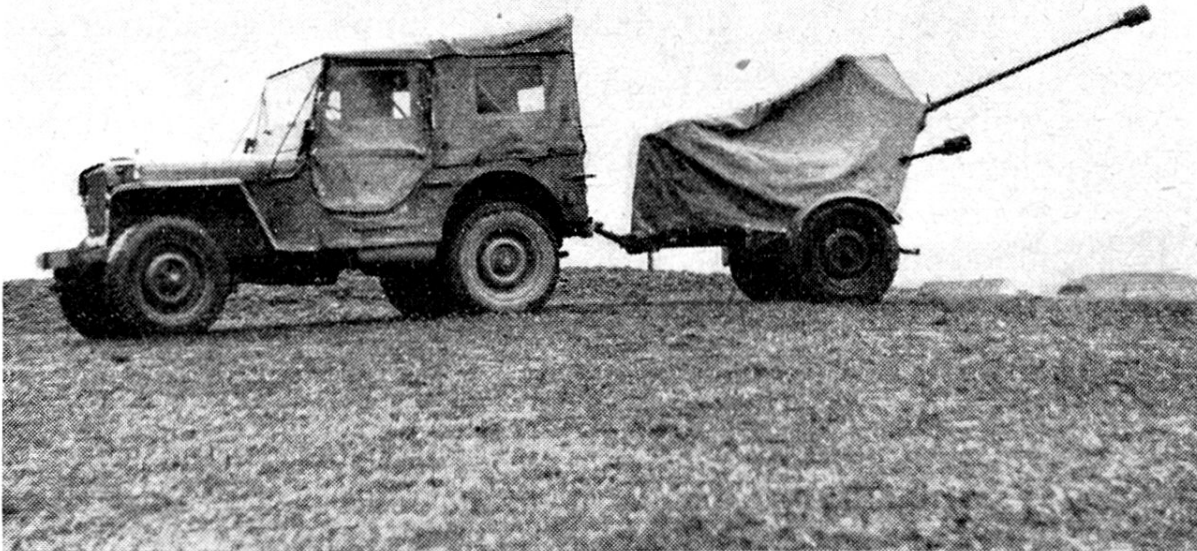
Abb. 3. 20-mm-Flab-K. 54 «Oerlikon» in Fahrstellung mit Geschützblache.

schwindigkeit als bedeutenden Fortschritt der Waffentechnik bezeichnen. Das in dieser Hinsicht weniger kritische Richten nach der Höhe erfolgt dagegen zwecks besserer Feineinstellung durch ein Handgetriebe. Für diese Waffe wurde ein neues Ellipsenvisier entwickelt. Auf einer Kunstglasplatte sind die Vorhalteellipsen für 150 - 300 - 600 - 900 - 1100 km/h Flugeschwindigkeiten eingeritzt und bleiben bei allen Beleuchtungen gut sichtbar. Bei Regen ist die Kunstglasplatte durch einige Handgriffe gegen ein Draht-Ellipsenkorn auswechselbar. Durch Wahl einer geringen Feuerhöhe läßt sich das Geschütz gut tarnen und rasch enttarnen.