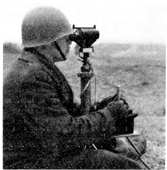
Le pilote à son poste