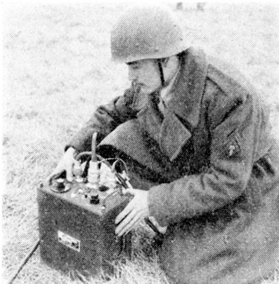
Opération de mise à feu