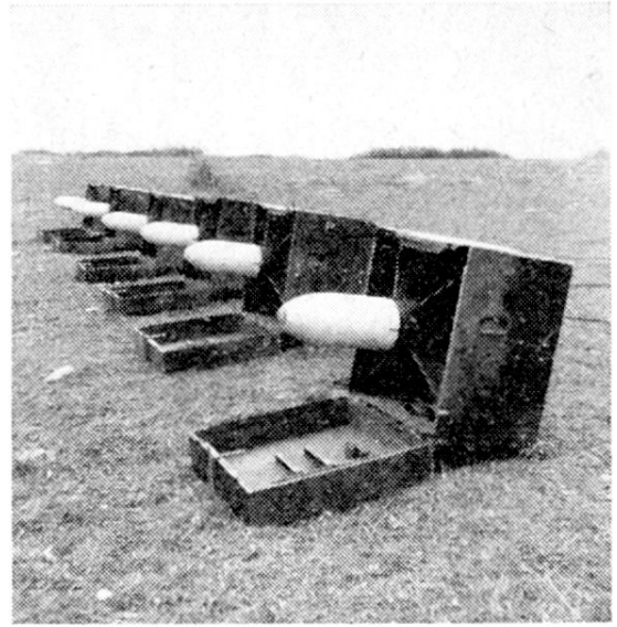
Vue générale de 6 SS 10 en batterie