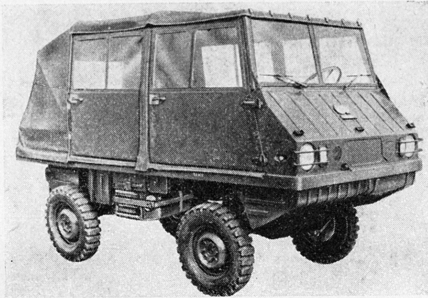
«Haflinger» mit großem Planverdeck