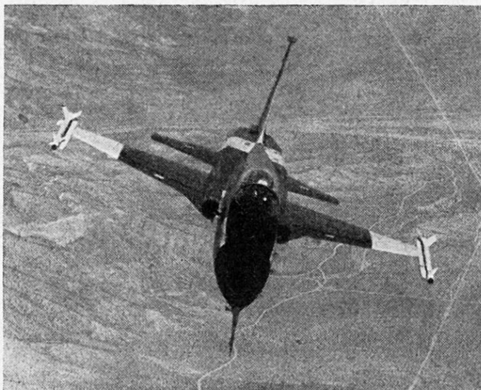
Fig. 2 Der N 156 F trägt im Jagdeinsatz an den Flügelenden zwei infrarotgesteuerte Luftkampfraketen «Sidewinder»

Eine außergewöhnliche konstruktive Lösung wurde beim Einbau der Triebwerke getroffen. Diese liegen im hinteren Rumpfteil nebeneinander. Die Nebenaggregate wie Hydraulikölpumpen und Generator sind nicht nach gebräuchlicher Art direkt an den Triebwerken angeflanscht, sondern vielmehr als selbständige Gruppe mit der Flugzeugzelle verbunden und