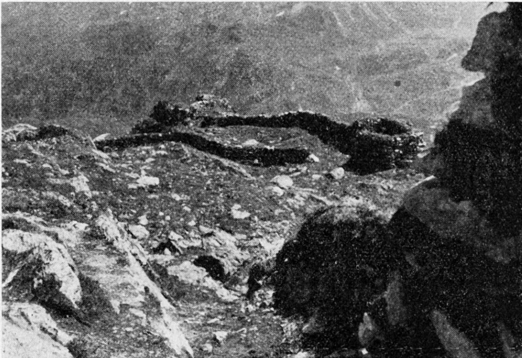
Stützpunkt, Geländeverstärkung auf Felsboden aufgebaut