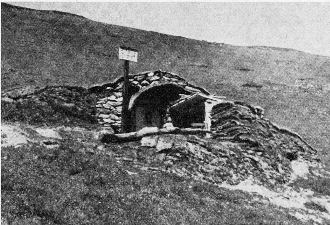
Stützpunkt, Unterstand für 10 Männer Die Tafel soll bei hohem Schnee und Schneeverwehungen die Lage des Unterstandes anzeigen