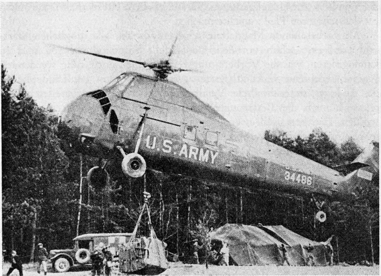
Bild 3. H 34-Helikopter fliegt Treibstoff zu eingekesselten Verbänden ein (amerikanische Manöver in Deutschland)

Schließlich sei festgehalten, daß sich auch der schwere Helikopter in Algerien bewährt hat, und daß eine zahlenmäßige Erhöhung der Bestände (Helikopter und Personal) notwendig erscheint. Das ist um so wichtiger, als es sich bei den Helikoptern um ausgesprochene Mehrzweckgeräte handelt, die sich neben den operativen Einsätzen bei allgemeinen Transportaufgaben, im Verbindungs- und Sanitätsdienst sowie bei Rettungsaktionen bereits bestens bewährt haben. HB