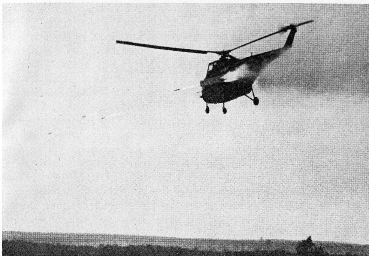
Bild 2. Abfeuern von Panzerabwehr-Raketen durch Helikopter

So wirkt die Aktion ziemlich schwerfällig. Mindestens 5 bis 10 Minuten vor der eigentlichen Landung werden Landeort und oft auch Absicht verraten, und die Fellaghas wissen diese Zeit gut zu nützen. Momentan wird aber diese Zeit noch als notwendig erachtet, um die Sicherheit der im Moment der Landung verwundbaren Helikopter zu gewährleisten. Ihre beschränkte Zahl gestattet es nicht, besondere Risiken auf sich zu nehmen. Doch wird alles unternommen, diese Vorbereitungszeit kürzer zu halten, eventuell sogar zugunsten der Überraschung überhaupt fallen zu lassen. Voraussetzung dafür sind: Erfahrung in der Zusammenarbeit, peinliche Funkdisziplin, äußerst genaue Vorbereitung.