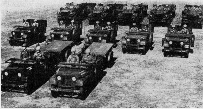
Bild 5. Lenkwaffen-Platoon der U.S. Kampfgruppe mit 75 Panzerabwehr-Lenk Waffen SS 10