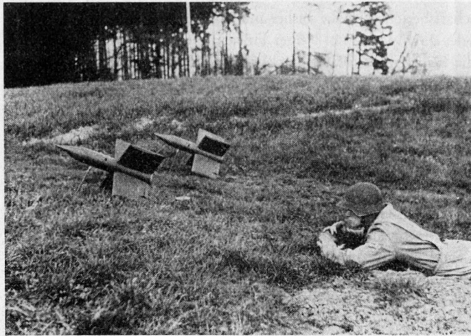
Bild 1 Panzerabwehr-Lenk Waffe «Mosquito» schußbereit ab Boden (Tarnung weggelassen)

Ähnlich wie bei Handgranaten, Gewehrgranaten, Minenwerfern und Geschützen die technische Reichweite den taktischen Einsatz