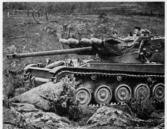
Bild 4. Leichtpanzer AMX der französischen Armee mit 4 Panzerabwehr-Lenk Waffen SS 11