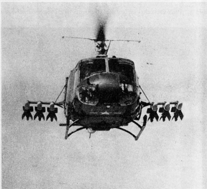
Bild 7. Panzerabwehr-Lenk Waffen SS 11 der U.S. Army Aviation ab Helikopter HU 1A