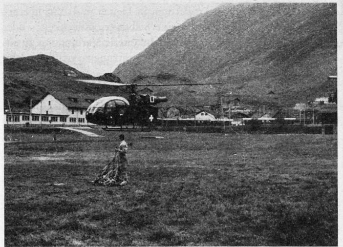
Bild 3. Bastlasten, in Tragnetz verpackt