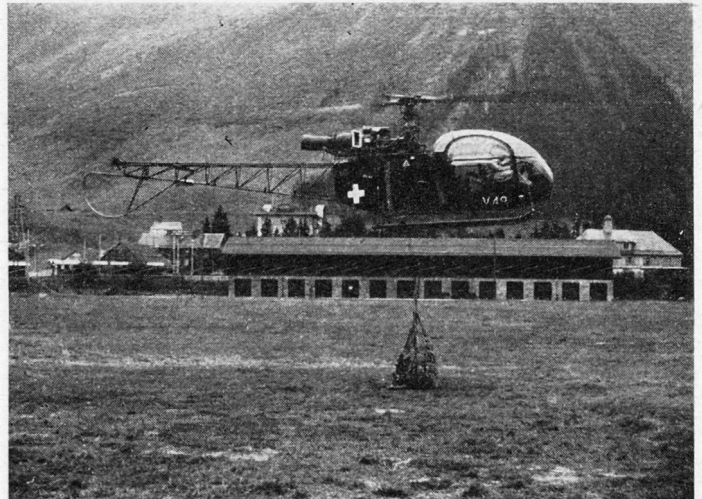
Bild 4. Volles Tragnetz am schwebenden Helikopter (Typ Alouette) angehängt