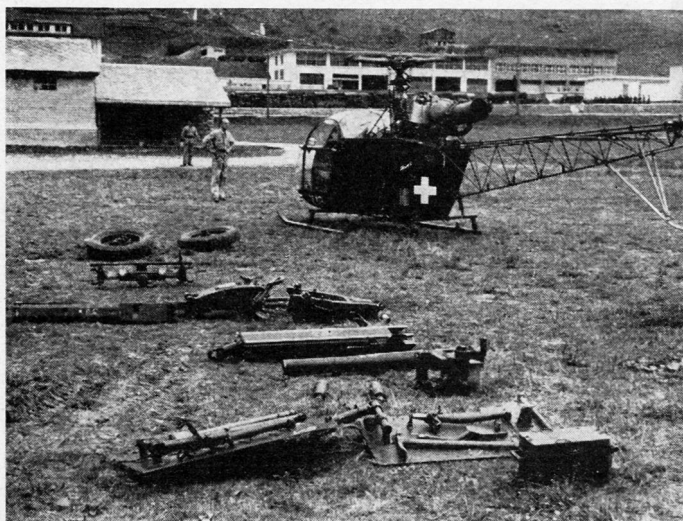
Bild 2. 7,5 Gebirgskanone, in Bastlasten zerlegt