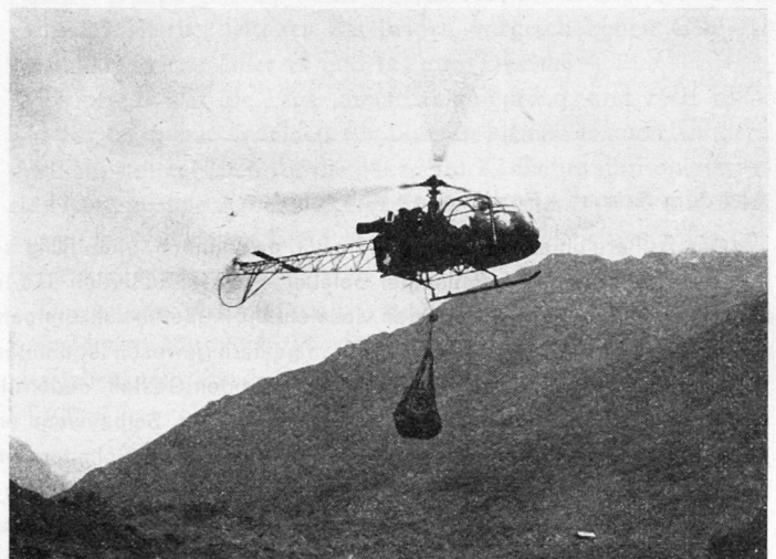
Bild 5. Der Flugtransport beginnt