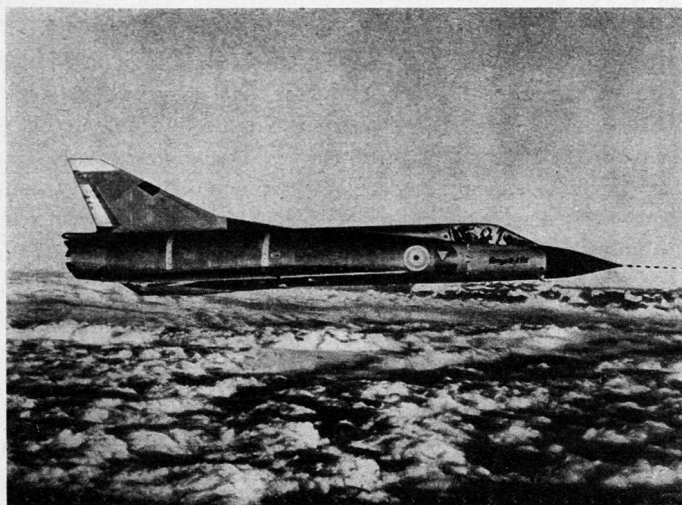
Dassault «Mirage III A»

Der letztgenannte Begriff sei kurz erläutert. Das Flugzeug stellt