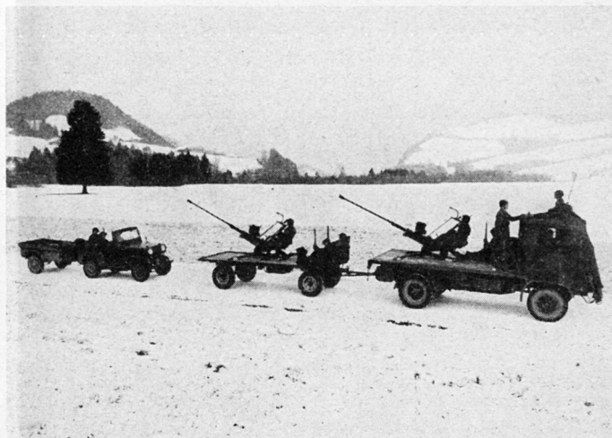
Bild 1 Flab-Gruppe mit improvisierter Selbstfahrlafettierung auf Lastwagen und Gepäckanhänger

Da unsere Fliegerabwehr mit Ausnahme der Panzer-Flab nicht selbstfahrend lafettiert ist, mußte nach einer Lösung gesucht werden, wie eine Selbstfahrlafettierung wenigstens behelfsmäßig durchgeführt werden könnte. Dabei handelt es sich bei der Infan-