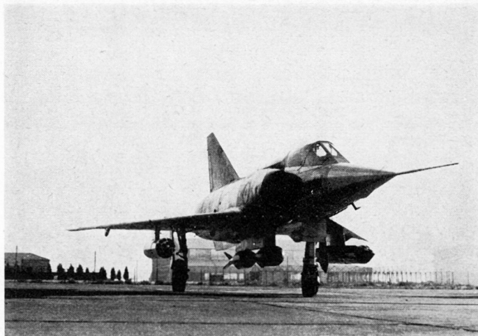
Mirage III, zum Erdkampf ausgerüstet mit 2 Kanonen 30 mm und 250 Schuß, 2 Sprengbomben zu je 400 kg, 2 Behältern mit je 18 Raketen 68 mm und 250 l Petrol im hintern Teil

Die Sprengbomben bilden immer noch das stärkste Zerstörungsmittel mit konventionellem Sprengstoff. Das Kaliber von 400 bis 500 kg, wovon zirka 50 Prozent Sprengstoff, hat sich allgemein durchgesetzt. Es wird mit guter Wirkung gegen Bauten, Brücken, Straßenengnisse, Kommandoposten, Pisten und ähnliche Ziele eingesetzt. Der Munitions-Aufwand ist sehr stark von der Abwurf-Technik abhängig, die ihrerseits durch die Wahl der Zünder mitbestimmt wird. Bei den erwähnten Zielen ist meistens der Verzögerungszünder zweckmäßig, der ohne Gefährdung des Flugzeuges eine kleine Abwurfdistanz erlaubt und damit gute Präzision ergibt.