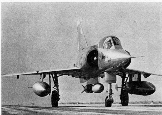
Mirage III, zum Erdkampf ausgerüstet mit 2 Kanonen 30 mm und 250 Schuß, 2 Sprengbomben von je 400 kg, 2 Zusatzbehältern für Treibstoff (oder Feuerbomben) von 820 l

Diese Waffen eignen sich hauptsächlich für die Bekämpfung von Punktzielen größerer Bedeutung – angesichts des erheb-