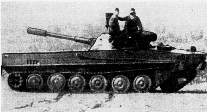
Bild 1. Spähpanzer PT 76

Seit etwa 1956 ist der schwimmfähige Spähpanzer PT 76 bei den russischen Aufklärungstruppen eingeführt. Gewicht zirka 16 Tonnen. Dieselmotor 300–350 PS. Straßengeschwindigkeit zirka 50 km/h. Wassergeschwindigkeit 8–10 km/h. Bewaffnung: Eine 76,2-mm-Kanone L48 (es besteht eine Version mit einer kürzeren 85-mm-Kanone), ein koaxiales Maschinengewehr.