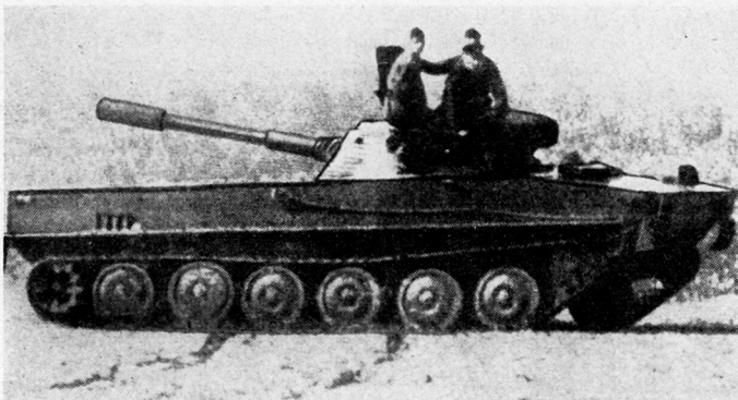
Bild 1. Spähpanzer PT 76

Seit etwa 1956 ist der schwimmfähige Spähpanzer PT 76 bei den russischen Aufklärungstruppen eingeführt. Gewicht zirka 16 Tonnen. Dieselmotor 300–350 PS. Straßengeschwindigkeit zirka 50 km/h. Wassergeschwindigkeit 8–10 km/h. Bewaffnung: Eine 76,2-mm-Kanone L48 (es besteht eine Version mit einer kürzeren 85-mm-Kanone), ein koaxiales Maschinengewehr.