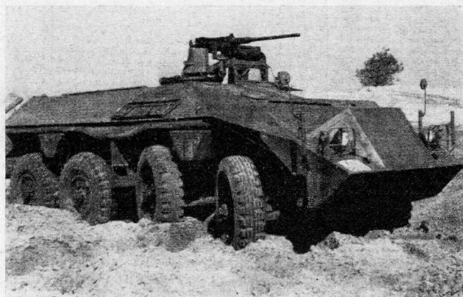
8 × 6 Schützenpanzerwagen, DAF YP 408