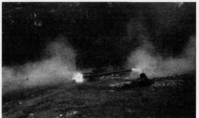
106-mm-BAT, Feuer ab Dreibeinlafette