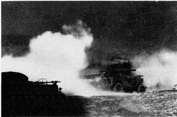
106-mm-BAT, Feuer ab Jeep

Anders liegen die Verhältnisse, wenn der BAT-Zug zur Verstärkung der Pzaw. in ein allgemeines Abwehrdispositiv eingliedert wird. Hier befindet man sich an der Hauptfront, und der BAT-Zug löst nicht mehr die Hauptaufgabe, sondern er ist spezialisierter Helfer. Er wird daher kommandomäßig stets dem Chef des betreffenden Frontabschnitts unterstellt; hier gehört der Befehl dem Infanteristen, jedoch sollte das Kommando nie weiter als bis zur Stufe Kp. hinabdelegiert werden, weil sowohl Stellungs- wie Feuerraum des BAT-Zuges den Abschnitt eines