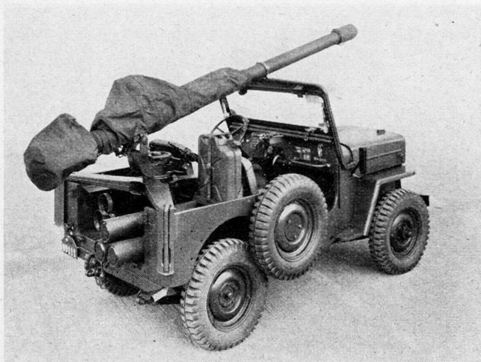
106-mm-BAT, Aufbau auf Jeep

Eine schwierige Frage ist sodann stets die Bezeichnung des Kdt. eines solchen Verbandes. Der Aufgabe entsprechend sollte er unbedingt Pzaw.Sachverständiger sein. Es drängt sich daher auf, den Kdt. Pzaw.Kp. über ein solches Detachment zu setzen; dies geht aber nur, wenn letzteres im Rahmen des Rgt. gebildet wird und der Rgt.Kdt. auf den Kdt. der Pzaw.Kp. als seinen