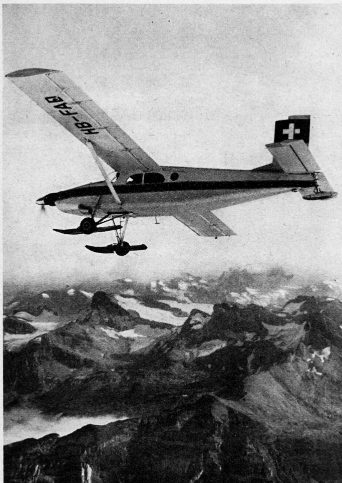
Abb. 1. Pilatus Turbo-Porter ASTAZOU 530 PS

schirmabsprung bei geschlossenen Kabinentüren sowie Anordnung von Photoausrüstungen. – Kabine: je nach Verwendungszweck bis 7 Passagiersitze oder Gestell für 2 Tragbahnen und 3 Sessel für Sanitätspersonal. 4 Führungsschienen, im Kabinenboden versenkt, dienen der Verankerung von Passagiersesseln, Tragbahnen, Kamera, Frachtgut. Motor: 3 Varianten. – Lycoming IGO-540 350 PS, sehr wirtschaftlich, nutzt die Leistungsreserven des Porters nicht voll aus. Gebläsemotor Lycoming GSO-480 340 PS, vorzügliche Leistung auch in größeren Höhen, zum Beispiel Hochgebirgseinsatz. – Für Turbo-Porter: Propellerturbine ASTAZOU II von Turbomeca, 530 PS. In der Anschaffung teures Triebwerk, im Betrieb wirtschaftlich infolge seiner Anspruchslosigkeit, größerer Revisionsintervalle und niedrigen Betriebsstoffpreises.