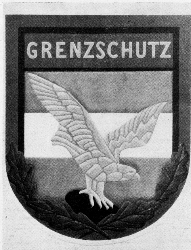
Abb. 2. Das Abzeichen des österreichischen Grenzschutzes.