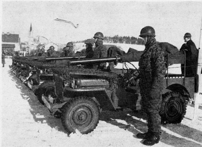
Abb. 1. rsf.Pak-Zug einer Grenzschutzeinheit.

Um eine finanzielle Belastung der Reservisten zu vermeiden, steht diesen für nachgewiesenen Erwerbsentgang eine Entschädigung bis zu sFr. 25.- täglich zu. Fahrtkosten werden vergütet, Unterkunft und Verpflegung sind frei. Studenten erhalten keine Entschädigung.