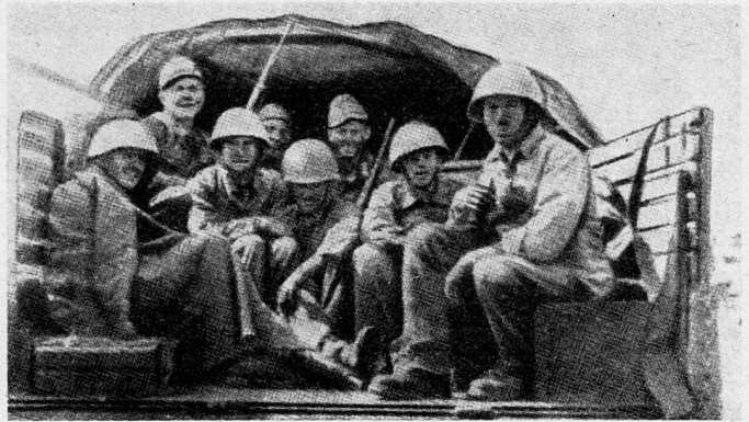
«Brandenburger» vor einem ihrer verbrecherischen Einsätze in Uniformen der Sowjetarmee»