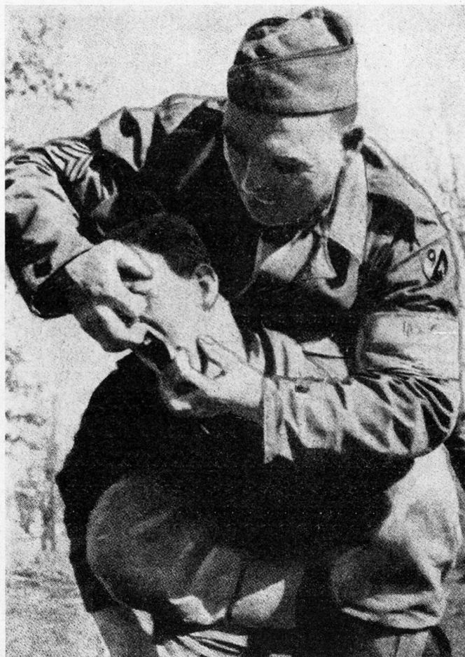
«Ausrenken des Kiefers mit Augenblendung üben die Zöglinge der 2. Rangerschule in Camp Forrest, Tennessee. Dieses bestialische Training wird besonders Truppen verordnet, die zur Unterdrückung ‚kolonialer Gebiete‘ vorgesehen sind»

Nun will uns freilich der Verfasser glauben machen, daß Operationen im «brandenburgischen» Stil außer durch die Deutschen zwar noch durch britische und freifranzösische Kommandos wie amerikanische «Sonderaufklärungsbataillone» praktiziert worden seien, was durchaus nicht zu bezweifeln ist, daß hingegen der Sowjetunion nicht ein einziger Fall unerlaubter Kriegführung nachgewiesen werden könne (S. 75). Das ist ein großes Wort gelassen ausgesprochen und kaum der Widerrede wert. Im Gegenteil! Der Verfasser hat es sich angelegen sein lassen, Hitler zu zitieren, um das Schändliche einer derartigen Kampfführung als einer Ausgeburt faschistischer Verworfenheit allgemein verständlich darzutun. In unmittelbarer Nachbarschaft der von ihm ausgewählten Sätze Hitlers stehen nun aber noch ein paar andere, die zu zitieren er wohlweislich unterläßt. Im gleichen Gespräch erklärt Hitler nämlich noch folgendes: «Meine Herren, wir wollen nicht Helden spielen, sondern den Gegner vernichten. Generäle wollen, trotz ihren Lehren vom Kriege, sich wie die Ritter aufführen. Sie glauben, Kriege wie die mittelalterlichen Turniere führen zu müssen. Ich brauche keine Ritter, ich brauche Revolu-