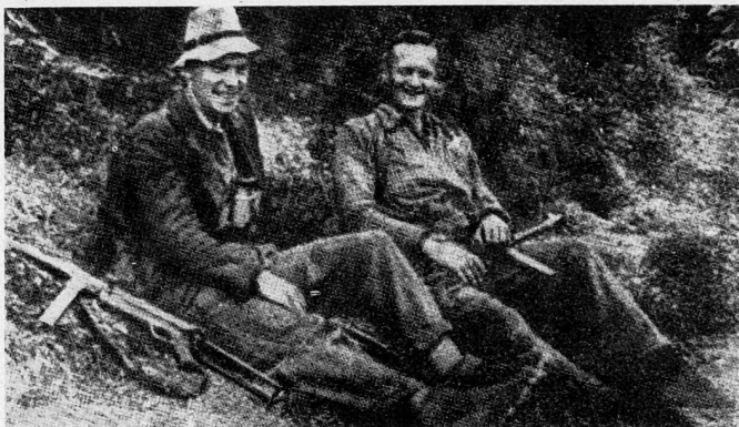
«Räuberzivil – ‚Brandenburger‘ 1943 im Einsatz auf dem Balkan»