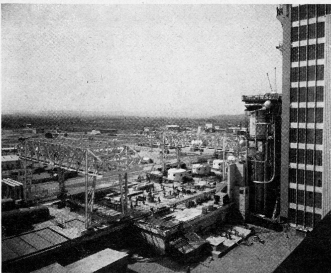
Bild 1. Marcoule. Teilansicht eines der Reaktoren von Marcoule

Im riesigen Werk von Pierrelatte, dessen Errichtung ungefähr 5 Milliarden Francs kosten wird – jährlich 1 Milliarde –, wird Uran 235 (angereichertes Uran) in fast reinem Zustand produziert werden. Dieses ist sowohl für die Fabrikation thermonuklearer Bomben als auch für den Antrieb von U-Booten und anderen Schiffen unerlässlich. Die Fahrt eines Schiffes benö-