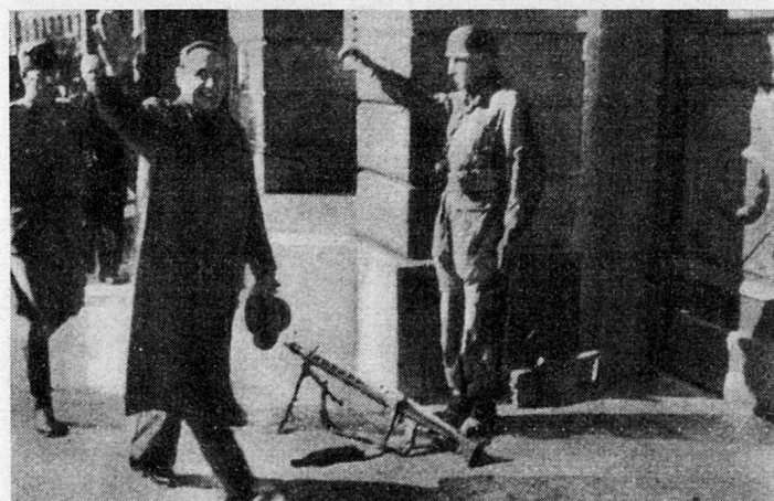
Bild 1. Major i. Gst. a. D. Ferenc Szálasi, der Führer der ungarischen Nationalsozialisten, zieht am 16. Oktober 1944 in die von deutschen Fallschirmjägern besetzte königliche Burg in Budapest ein.

Es ist im Westen wenig bekannt, daß im Spätherbst 1944 in Budapest einige hohe ungarische Offiziere in Verbindung mit Politikern bürgerlicher Prägung trotz dem mißglückten «Aufstand der Generale» in Hitler-Deutschland sich gegen das in Ungarn herrschende Regime wandten. Die verzweifelte Lage des Landes zwang sie zu dieser Tat. Am 15. Oktober 1944 mißlang nämlich der Versuch des Reichsverwesers Miklós von Horthy, Ungarn durch einen Separatfrieden aus dem Kriege zu retten und somit dem Volk das Leiden eines totalen Krieges auf eigenem Boden zu ersparen 1 . Der deutsche Sicherheitsdienst, der aus den Geschehnissen in Bukarest und Sofia anscheinend die Lehre gezogen hatte, schlug rechtzeitig zu, erstickte von Horthys Versuch im Keim, nahm den greisen Reichsverweser in Gewahrsam und setzte an seine Stelle den Führer der ungarischen Nationalsozialisten, den «Pfeilkreuzler» Major i. Gst. a. D. Ferenc Szálasi, ein 2 . «Der Führer der Nation» (Nemzetvezető), wie Szálasi sich nachher bescheiden nannte, erwies sich von der ersten Minute seiner Machtübernahme an als ergebener Diener Hitlers. Der Kampf, welcher für Ungarn ohne nationales Inter-