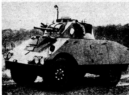
Bild 1: Ausführung A des Spähpanzers F.N. 4 RM/62 mit 90-mm-Kanone «Cati».