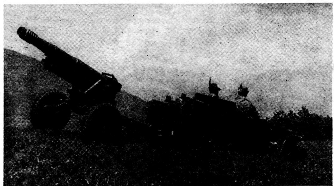
Bild 3. Gebirgshaubitze 105/14 im Autozug.

Zusammenfassend also muß die Gliederung so geplant sein, daß sie nie die Möglichkeit ausschließt, die Feuerzusammenfassung auf jedweder Stufe zu erreichen, wobei aber auch die