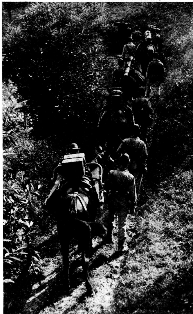
Bild 4. Gebirgshaubitze 105/14 im Tragtiertransport.

Manchmal wird das Gelände noch mehr als die Taktik eine Aufteilung der «Gruppeneinheit» fordern. Da man auf alle Fälle eine dichte Aufstellung der Artillerie in den Becken vermeiden soll, um keine lohnenden Ziele zu bilden, wird es öfters nötig sein, die Batterien in unwegsamem Gelände einzusetzen, wo es nicht immer leicht ist, eine ganze Abteilung zusammenzuhalten.