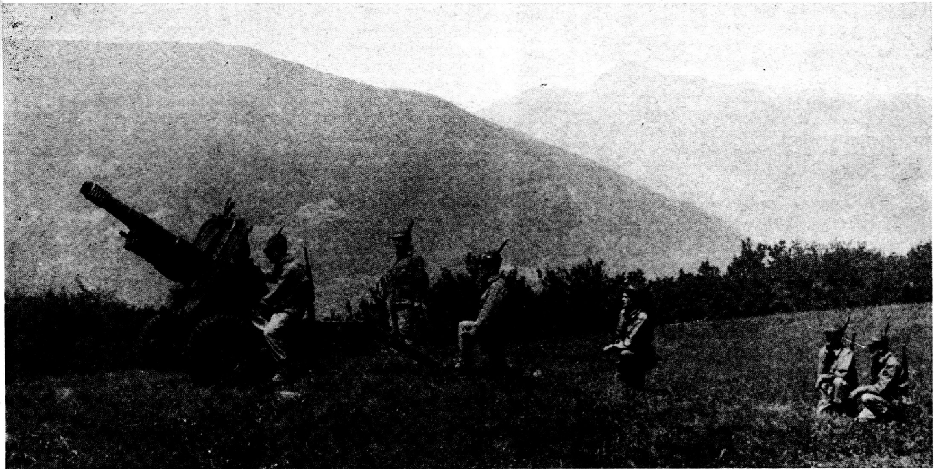
Bild 2. Gebirgshaubitze 105/14 in Feuerstellung mit Erhöhung in oberer Winkelgruppe.