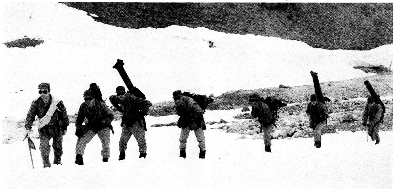
Bild 5. Gebirgshaubitze 105/14, Mannschaftstransport in die Feuerstellung im Hochgebirge.

Die beiden Stufen, die für die Beobachtung durch die Artillerie sorgen müssen, sind das Abteilungskommando und das Artilleriebrigadekommando. Dabei muß man bedenken, daß das Abteilungskommando nicht nur Brennpunkt der vorgeschobenen Beobachtung ist, sondern daß es im Gebirge auch notwendig werden kann, die Beobachtung in die Tiefe organisieren zu müssen.