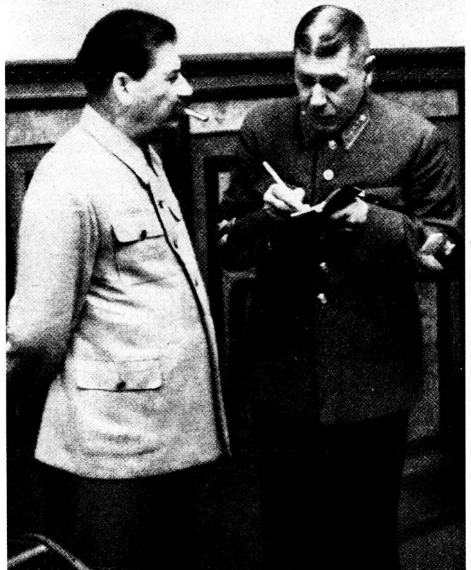
Bild 3. J.W. Stalin und sein Generalstabschef, Marschall Schaposchnikow. (Dieses seltene Bild wurde von deutschen Photoreportern kurz nach Abschluß des deutsch-sowjetischen Freundschaftsvertrages im Kreml in der Nacht vom 28. auf den 29. September 1939 aufgenommen.)