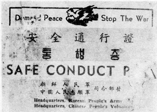
Bild 4. Ein Freipaß, der von der nordkoreanischen Propaganda und den chinesischen Freiwilligen im Koreakrieg an amerikanische Soldaten gerichtet worden war. Er war als kleines Büchlein aufgemacht, in einer Zellophanhülle versorgt und zeigte auf seinen Innenseiten Bilder aus dem beruflich interessanten und unterhaltsamen Lagerleben amerikanischer Soldaten in nordkoreanischer Gefangenschaft.

Ein Überläuferausweis garantiert in der Regel dem Empfänger, daß er sich gefahrlos in Gefangenschaft geben kann, zeigt Mittel und Wege, wie die Übergabe zu bewerkstelligen ist, und verspricht das, was einem Soldaten, der vom Chaos einer Kriegsfrent erschüttert ist, besonders wünschenswert erscheinen muß, nämlich die Entfernung aus der Gefahrenzone, gute Behandlung in der Gefangenschaft, Verpflegung, ärztliche Behandlung, Verbindungsaufnahme mit den Angehörigen, Rückkehr in die Heimat nach Kriegsende, Weiterbildungsmöglichkeit in der Gefangenschaft und ähnliches (Bild 5).