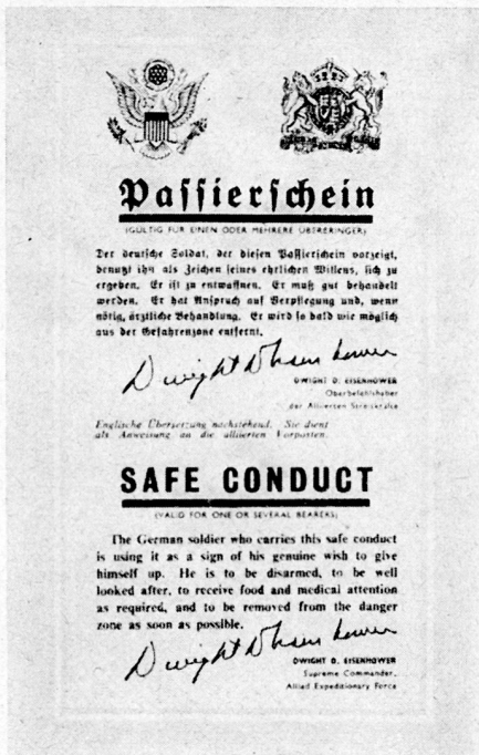
Bild 10. Der wohl berühmteste Passierschein wurde 1945 an der Westfront eingesetzt. Er ist als Wertpapier aufgemacht und trägt die Faksimileunterschrift General Eisenhowers. Dem Empfänger werden gute Behandlung, Entfernung aus der Gefahrenzone, Verpflegung und ärztliche Behandlung zugesichert. Das Papier ist weiß, die Randguillochen rot. Das Blatt ist 21 cm hoch. Interessanterweise existiert ein Falsifikat deutschen Ursprungs, das sehr ähnlich aussieht, wobei aber der ursprüngliche Text ins Lächerliche abgeändert worden war.

nen ergibt, daß die ersten Flugblattkampagnen keinen namhaften Eindruck bei den anvisierten Fronttruppen erweckten. Dann aber förderten Leseverbote und Brandmarkung der Feindpropaganda in Tagesbefehlen und Rundfunksendungen der deutschen Kommandostellen unbeabsichtigt, aber offenbar nachdrücklich das Interesse der Soldaten. Ebenso aufschlußreich ist der Umstand, daß gleichzeitig zu den taktisch an die Fronttruppen eingesetzten Flugblättern strategisch an die deutschen Frauen, die Eisenbahner und andere Gruppen der Heimatfront gerichtete Botschaften eingesetzt wurden, wobei der Kontakt deutscher Urlauber und Verwundeter mit den endemischen Propagandaträgern der Heimat in vielen Fällen entscheidend zum Desertionsentschluß beigetragen hat (Bild 11).