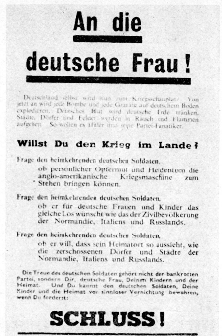
Bild 11. Die Vorbereitung der Übergabe von Fronttruppen wird in strategischem Einsatz von Flugblättern an bestimmte Gruppen der Heimatfront unterstützt. Das hier abgebildete Flugblatt stammt aus dem zweiten Weltkrieg.

In den modernen Kriegen hat sich gezeigt, daß die Wahrheit in den Schilderungen der militärischen Situation ihren Eindruck nie verfehlt und sich als Propagandavorspann hervorragend eignet. Man weiß auch, daß Flugblätter in unglaublich vielen