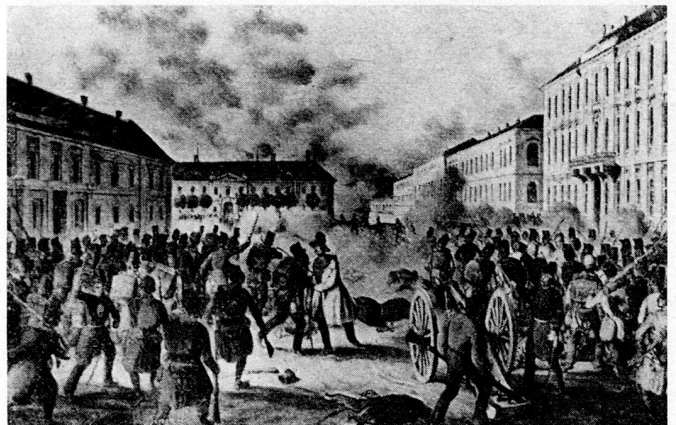
Bild 5. Der Tod General Hentzis während des Endkampfes in der Festung.

Drei Angriffe waren nötig, bis die Honvéds die Wälle an den vorgesehenen Punkten bezwingen konnten. Sie erlitten dabei schwere Verluste. Doch endlich waren sie oben in der Festung – nicht zuletzt durch die tatkräftige Unterstützung seitens der Jäger des Ceccopierie-Bataillons, die von der Brustwehr aus behilflich waren, den Anstürmenden die Leitern anzulegen, und den Honvéds ihre Hände herabreichen, um sie über die Brustwehr hinaufzuziehen. Mit dem Erscheinen der Honvéds auf den Basteien schlossen sich auch viele Italiener den Ungarn an und drangen gemeinsam mit ihnen in das Innere der Festung ein. General Hentzi gab jedoch den Kampf noch nicht auf. Er zog sich mit dem Rest seiner Truppen auf den Györgyplatz zurück und versuchte, durch rasch herbeigeschaffte Geschütze die Honvéds mit Kartuschen von der Bastei zu vertreiben. Danach befahl er einen Gegenangriff, den er mit gezogenem Säbel selbst zu führen beabsichtigte. «Nur vorwärts!» rief er dabei den kroatischen Infanteristen zu. «Kinder, stürmt! Ihr müßt sie hinauswerfen!» Dies waren Hentzis letzte Worte. In dieser Minute traf ihn eine Gewehrkuugel in die rechte Magenseite. Er starb nach einigen Stunden in einem Notspital, ohne daß er den Fall der Festung erlebt hätte.