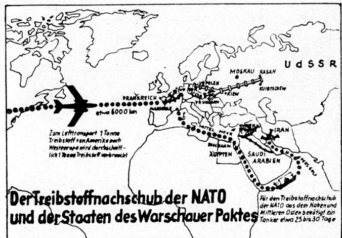
Bild 22. Der Treibstoffnachschub der NATO und der Staaten des Warschauer Paktes in osteuropäischer Sicht – eine Quelle der sowjetischen «Überlegenheit».

Die Stärke der Armeen der Warschauer-Pakt-Staaten tritt unter anderem am augenfälligsten in ihrer einheitlichen Bewaffnung und technischen Ausrüstung zutage. Die einheitliche Militärtechnik bietet der Truppenführung vielseitige Vorteile bei Gefechthandlungen und für die Ersatzteilbeschaffung. Darüber hinaus kann das Material in größeren Serien hergestellt und dadurch mit niedrigeren Kosten rasch bei der Truppe eingeführt