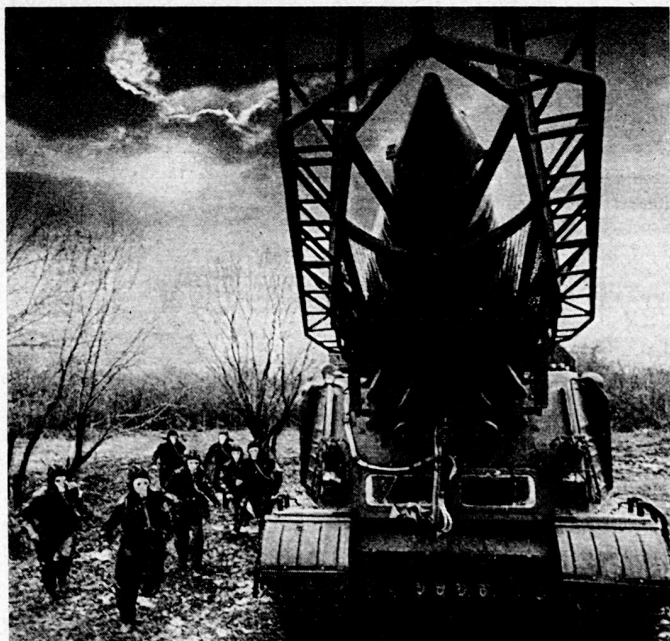
Bild 16. Taktische Raketen – Hauptfeuerkraft der polnischen Landstreitkräfte.

stalinisierungswelle in Polen erzwang einen Wechsel in der Parteiführung gegen den Willen Moskaus. Wladyslaw Gomulka wurde durch die nationalkommunistischen Kräfte zum Leiter der KP Polens erkoren und es stand ein offener Konflikt mit der Sowjetführung bevor, der aber schließlich vermieden werden konnte. Nach den Oktober-Ereignissen kehrten die meisten sowjetischen Offiziere nach Rußland zurück; Rokossowski mußte aus dem Politbüro der KPP ausscheiden und trat als Verteidigungsminister zurück. Auch in den übrigen hohen Kommandostellungen sind die Sowjetgenerale durch polnische Offiziere abgelöst worden. Die polnischen Soldaten machten kein Hehl aus ihren antisowjetischen Neigungen; der offene Ausbruch wurde lediglich durch die Aufrufe Kardinal Wyszynskis und die Konzessionen Moskaus an Gomulka verhindert, die bezeichnenderweise eine fühlbare Entstalinisierung und Entrussifizierung der Armee selbst einschlossen. Durch eine polnisch-sowjetische Vereinbarung ist am 18. November 1956 die Freizügigkeit der in Polen stationierten sowjetischen Truppen beträchtlich eingeschränkt worden. Als weiteres Beispiel der «Liberalisierung» ist die größere Unabhängigkeit der Armee von der Überwachung durch die Organe des Staatssicherheitsdienstes anzusehen. Ein dementsprechender Gesetzesentwurf wurde am 30. Dezember 1957 dem Sejm zugeleitet 30 .