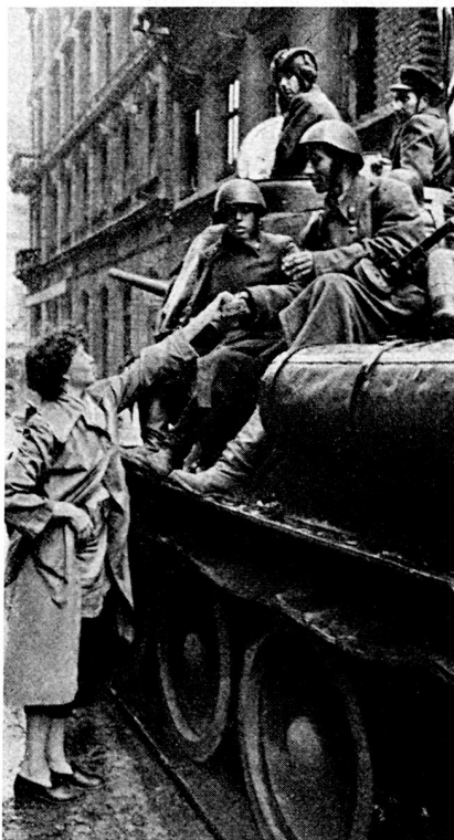
Bild 18. Ungarische Volksarmisten auf der Seite der Aufständischen.