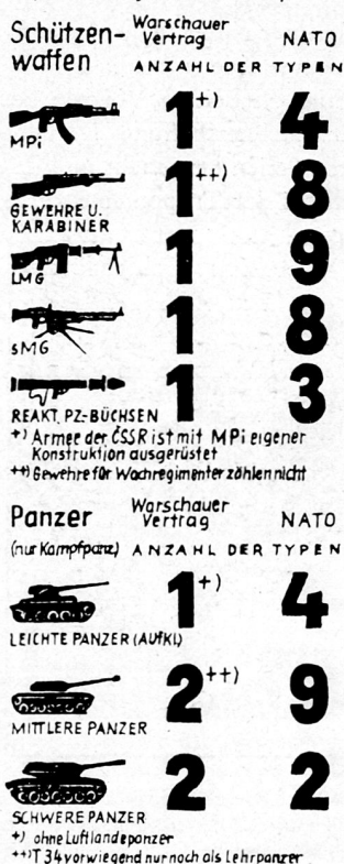
Bild 23. Einheitliche Ausrüstung der Armeen des Warschauer Vertrages.