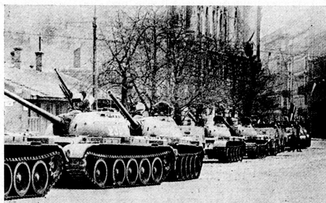
Bild 17. Budapest 1956: Die erste bewaffnete Aktion auf Grund des Warschauer Vertrages – Kampf der Sowjettruppen gegen ein Mitgliedstaat.