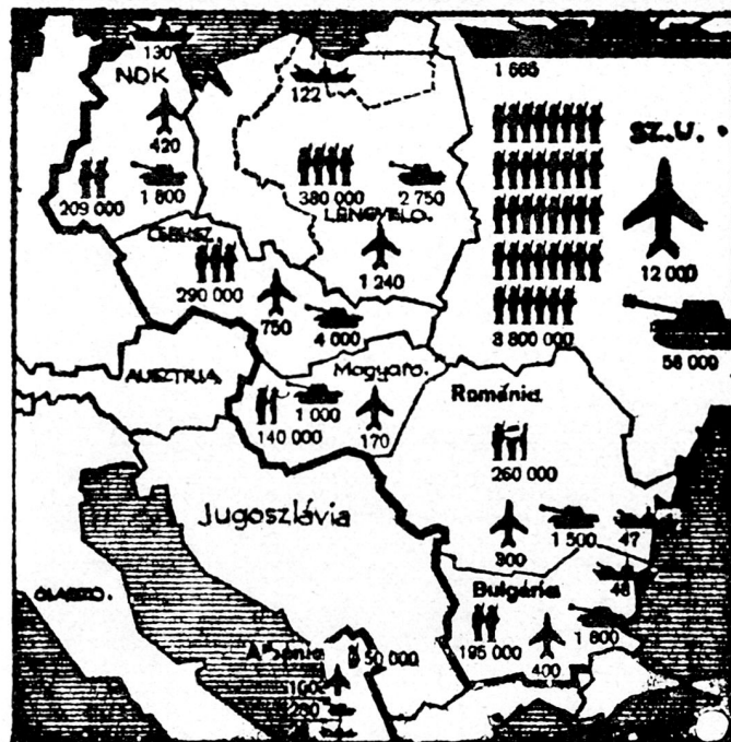
Bild 19. Darstellung der bewaffneten Kräfte der Warschauer-Pakt-Staaten in einer jugoslawischen Zeitung. Stand 1966/67.

Auch im späteren waren die Polen der Ansicht, daß «der Warschauer Pakt nicht als eine legale Basis der Aktionen der sowjetischen Streitkräfte während der tragischen Ereignisse, die in Ungarn stattfanden, gebraucht werden kann 35 .» Die jahrelang geschulte Ungarische Volksarmee kämpfte mit vielen Einheiten an der Seite der Aufständischen und man mußte feststellen, daß während der Volkserhebung nicht wenige Sowjetsoldaten gegen ihre rebellierenden «Brüder» nur zögernd zu den Waffen griffen. Eine zwar kleine, aber doch höchst bedeutsame Anzahl von Sowjetsoldaten ging damals zu den «Konterrevolutionären» über und andere verhielten sich neutral. Zuletzt ergab sich die Notwendigkeit, die sowjetischen Besatzungstruppen durch frische Kräfte abzulösen, die aus Einheiten nicht-europäischer Herkunft bestanden und den Ungarn gegenüber keine besondere Verbundenheit empfanden 36 .