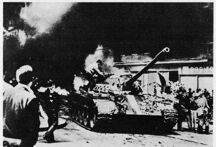
Bild 1. Dialog unter lebensgefährlichen Umständen mit Besetzungstruppen.