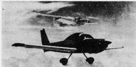
Der neue Pionierpanzer des Heeres

Nachdem der Kampfpanzer «Leopard» und der Bergepanzer «Standard» sich bei der Truppe bewährt haben, wurde ein Pionierpanzer mit im Fahrgestell gleichen Bauteilen entwickelt. In den Hauptbaugruppen der Bergeeinrichtung ist der Pionierpanzer darüber hinaus aus logistischen Gründen gleich mit dem Bergepanzer «Standard» . Der bei der Pioniertruppe zum Einsatz vorgesehene Pionierpanzer soll die Kampftruppe vornehmlich beim Überwinden und Anlegen von Hindernissen sowie Herstellungen von Deckungen unterstützen.