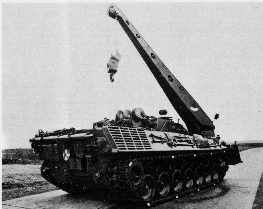
Seitenansicht der Pionierpanzer. Drehkran in Arbeitsstellung.

Die am Pionierpanzer vorhandene Winde sowie der Drehkran werden ebenso wie beim Bergepanzer «Standard» hydraulisch angetrieben. Die Zugkraft der Seilwinde mit 70 t im Doppelzug und der Drehkran mit 20 t Tragkraft stellen zusammen ein wertvolles Hilfsmittel dar, damit auch beim Einsatz in schwierigem Gelände Pionierarbeiten aller Art unter