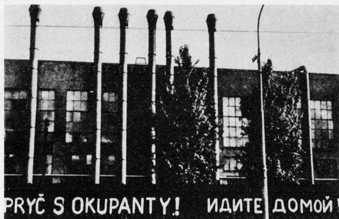
Bild 8. Arbeiterhaß gegen Okkupanten: «Okkupanten raus! – Geht heim!!»

Der Einmarsch der Truppen der Warschauer-Pakt-Staaten in die Tschechoslowakei ist zweifellos ein klassisches Beispiel der Aggression 29 . Dieser Fall wurde auch im Sicherheitsrat bei der Abstimmung über die im Zusammenhang mit dieser Frage eingebrachte Resolution als solche qualifiziert. Das Urteil der meisten Mitglieder des Sicherheitsrates konnte aber keine Rechtskraft erlangen, da die Resolution infolge des von einem ständigen Mitglied des Sicherheitsrates – das heißt von der Sowjetunion, der unmittelbaren Teilnehmerin an dieser Aggression – eingelegten Vetos keine Gültigkeit erhielt.