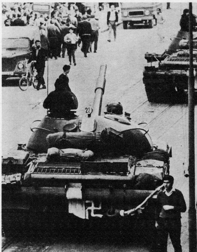
Bild 6. Abfuhr für Okkupanten: Die Tschechoslowaken malen Hakenkreuze auf Panzer der Eroberer.

Eine polnische Armee mit vier Divisionen rückte auf fünf verschiedenen Stellen mit Marschrichtung auf Gottwaldow, Olmütz, Nordmähren, Pardubitz und Prag ein. Von den polnischen Einheiten, die die CSSR besetzten, waren vor allem die «Sudetenbrigade» (Wehrkreis Schlesien), die 6. pommersche Luftlandedivision, genannt die «Roten Barett», ferner zwei motorisierte Schützendivisionen und eine Düsenflugzeugdivision beteiligt.