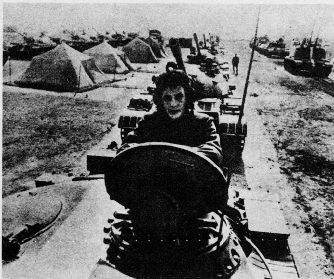
Bild 9. Sowjetische Besetzungstruppen auf einer Anhöhe am Rande von Prag. Sie bleiben unbestimmte Zeit im Land.

Überraschenderweise haben jedoch die Teilnehmer an dieser Aggression erklärt, daß ihnen das Recht zusteht, sich – selbst mit bewaffneter Gewalt – in die inneren Angelegenheiten anderer Mitgliedstaaten des Warschauer Paktes einzumischen, wenn es sich dabei ihrer Ansicht nach «um die Rettung des sozialistischen Systems» handelt. Seit dem 21. August stellt sich hier die entscheidende Frage, ob dieser Vertrag wirklich so geartet ist, daß er für eine militärische Einmischung in die inneren Angelegenheiten die Möglichkeit bietet. Ferner ist es fraglich, ob er im Falle einer Bejahung des vorhin erwähnten Vertragskonzeptes auch den realen Willen beider interessierter Seiten darstellt. So war nämlich die endgültige Konsequenz dieses Vertrages die