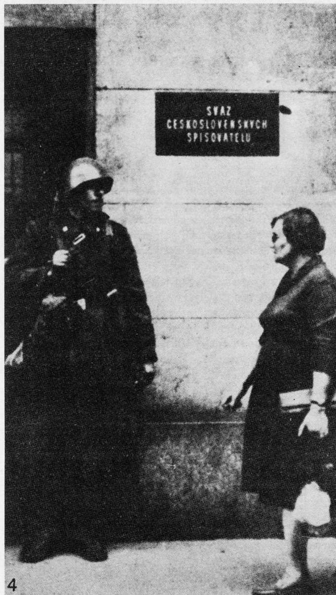
Bild 7. Das Gebäude des tschechoslowakischen Schriftstellerverbandes – «Zentrum der Konterrevolution» – unter sowjetischer Bewachung.

Zu diesem gravierenden Schritt haben sich die Sowjets unserer Ansicht nach nur entschlossen, weil sie durch das Prager Experiment «Freiheit im Sozialismus» ihr Reich, ihr System und ihre Herrschaft bedroht sahen 28 .